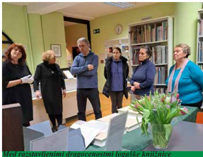
Med razstavljenimi dragocenostmi logaške knjižnice