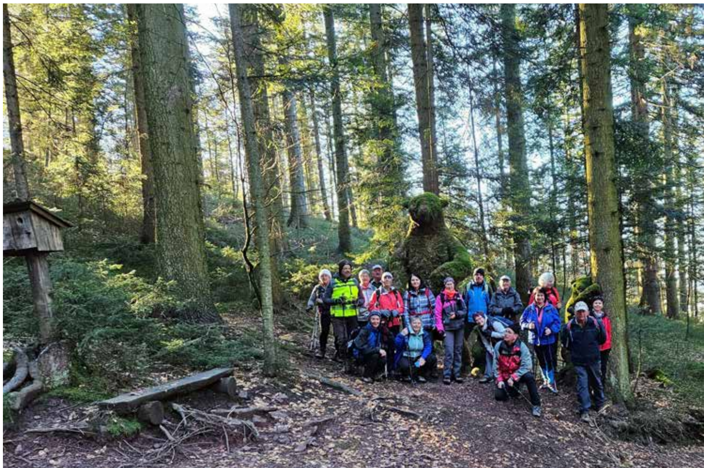
Pod skozi Zalo