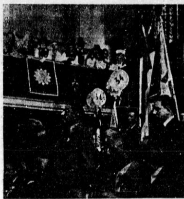
Predsednik vlade govori.

Lepo dekorirana dvorana z veliko sliko kralja Petra II. v ozadju nad odrom, se je napolnila do zadnjega kotička z balkonom vred. Ko so prišli v dvorano visoki dostojanstveniki in odličniki in zasedli svoja mesta na odru, je nastalo viharno vzklikanje dr. Korošcu, Cvetkoviću, dr. Kreku, kraljevskemu domu, Jugoslaviji in slovenskemu delavstvu.