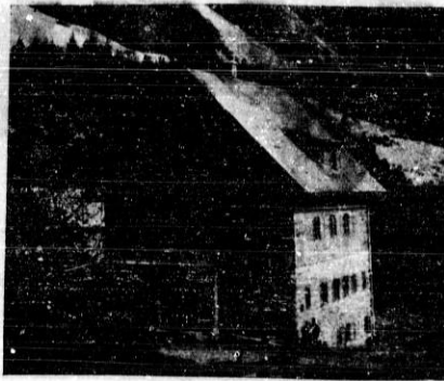
Valvazorjeva kočica pod Stolom.

kočo iskreno čestitamo, pozabiti pa ne smemo tudi marljivega načelnika g. Rojca, ki se je ves in vselej žrtvoval za novo kočico, vodil vse delo in nadzorstvo gradnje.