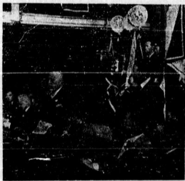
Dr. Anton Korošec med govorom.

Prvi tabor slovenskega katoliškega delavstva v Ljubljani je bil tako mogočen, tako veličastna manifestacija stanovske in narodne zavednosti ter volje do ustvaritve novih razmer v delavskem strokovnem pokretu, da tako lepega in tako mnogo obetajočega dne slovensko organizirano delavstvo v zgodovini svojega gibanja ne pomni, in ki nam obenem