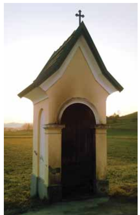
Črna notranjost. Potrebna bo obnova.

Težko razumem misli povzročitelja, ki so ga napeljale do tega dogodka. Zgroženi smo bili vsi! Bili smo brez besed, da človeška hudobija premore tako nespodobna dejanja.