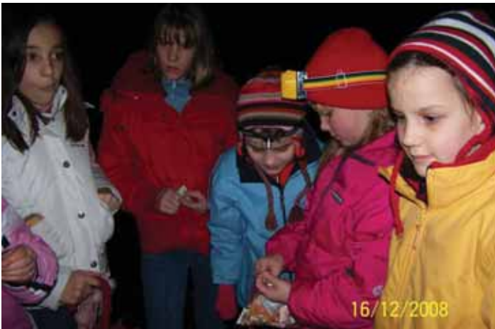
Le kaj so nam pustili škrtatki?