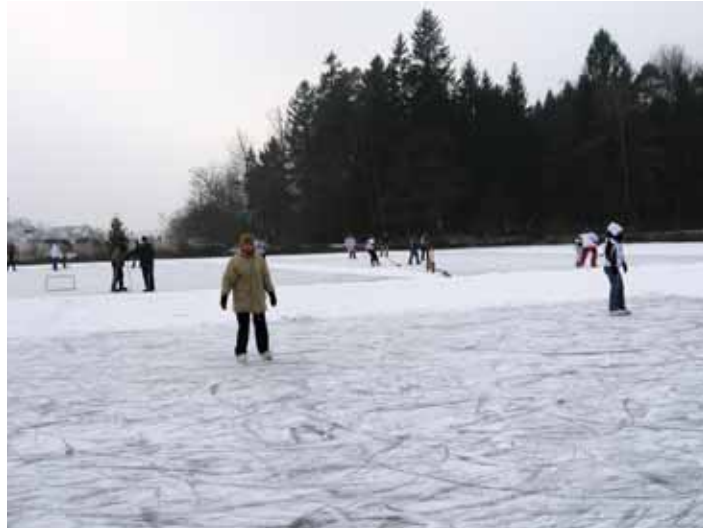
Na dveh očiščenih igriščih se igra hokej, na tretjem pa se drsajo

Na zamrznjenem (Španovem bajerju – ljudsko) na Prevojah letos drsamo in igramo hokej že od 5. januarja dalje. Tako mladi kot starejši si vedno, ko zamrznejo bajerji na Prevojah, obujemo drsalke in izkoristimo