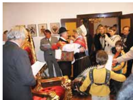
Folklorni utrinek s prireditve