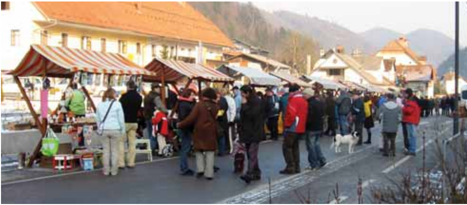
Obiskovalci so tudi nakupovali