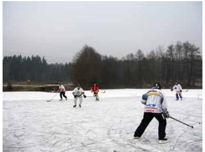
Hokejisti v akciji

vsak dan za drsanje ali igranje hokeja. Letos je led še posebno trd in dober za igranje hokeja. Stari mački v hokeju se še ne damo in to dokazujemo kljub letom z dobro igro. Tako kot je bilo včasih, je tudi danes: ko se na Prevojah rodi otrok, ima že drsalke na nogah. Veliko je tudi začetnikov in to navdušuje kljub buškam, ki jih dobijo ob padcih. V nedeljo popoldan, 11. januarja, se je na ledno ploskev na Prevojah podalo že preko 100 drsalcev in hokejistov.