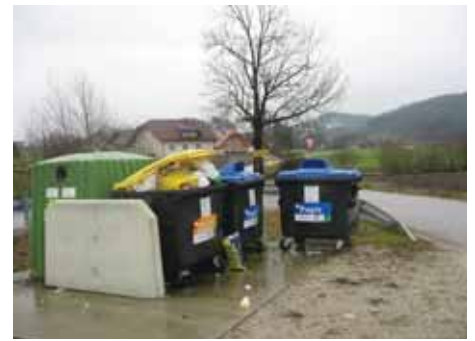
Imovica, nedelja, 14. 12. 2008