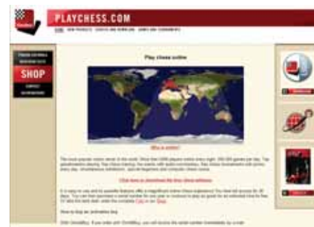
Spletna stran Playchess.com

Kot v trenutni svetovni situaciji, se tudi na spletni ljudje obnašajo na način, ki ga zagotovo