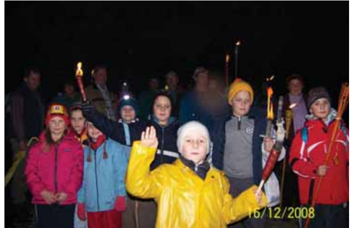
Drugo leto spet pridemo.