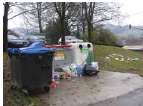
Lukovica – pred trgovino, nedelja 21. 12. 2008