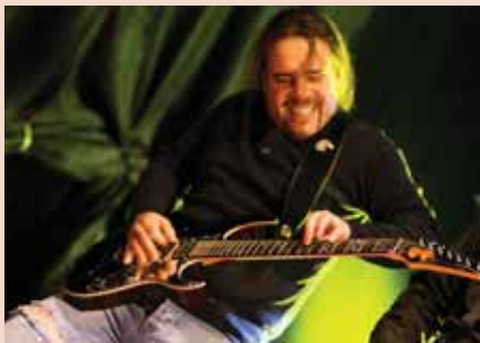
»Ker Marjan dela to z občutkom!«