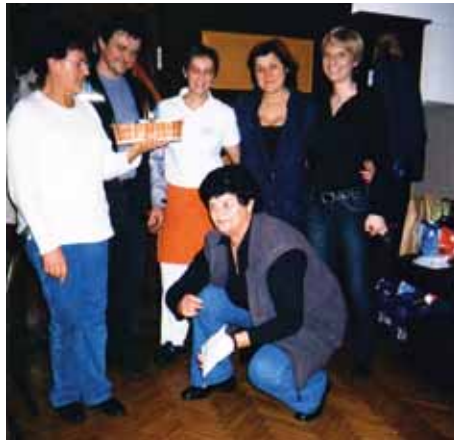
Moravški upokojenci prvič v gostilni RUS v Šentvidu pri Lukovici

V polni gostilniški sobi, v kateri smo upokojenci preživljali zaključek leta 2008, smo si zaželeli še več takih srečanj v letu 2009, posebno pa medsebojnih pristnih odnosov in nasmejanih obrazov.