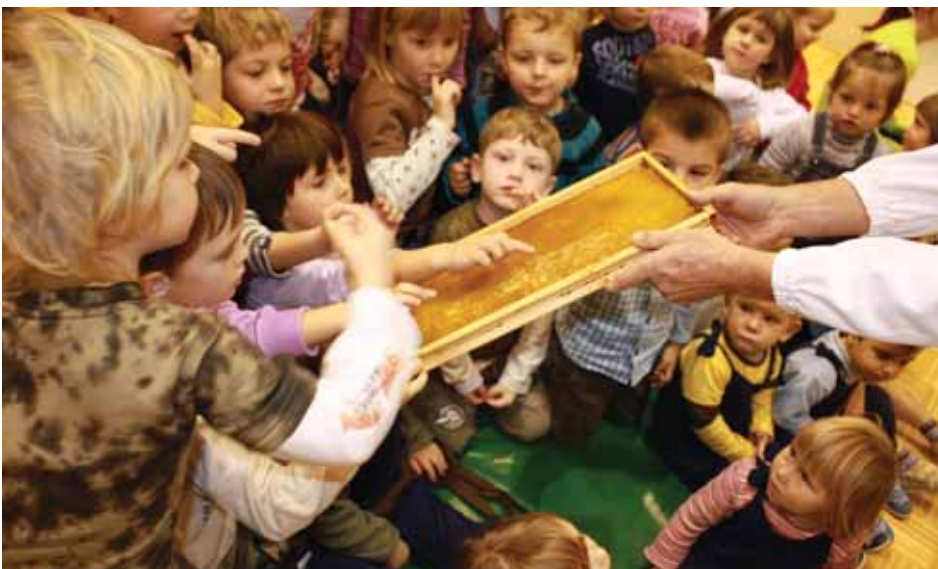
Mmmm...kako je sladek

Malčki so nas veseli in razigrani z otroško radovednostjo sprejeli. Čeprav so nekateri še od lanskega obiska vedeli, zakaj smo prišli na obisk, je pogovor o čebelarjenju, čebelah in njihovih pridelkih hitro stekel. Pokazali so