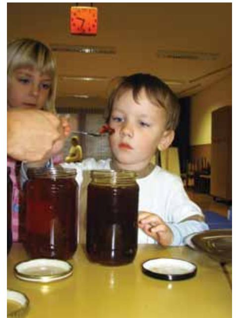
Ko bom velik bom tudi jaz čebelar

kar primerno znanje o življenju čebel in delu z njimi, kar nekaj jih je tudi povedalo, da imajo čebele doma, pri sosedih ali pa je čebelar kdo od sorodnikov.