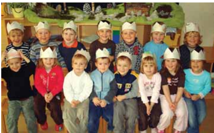
Skupina Metuljčki iz vrtca Medo s Prevoj pri Šentvidu

Povabili smo otroke iz ostalih skupin, da so si ogledali naše jaslice. Za praznik svetih treh kraljev pa so si otroci čisto sami izrezali in pobarvali krone. Tako so si še bolj približali praznik.