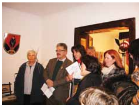
Predstavitev grba Občine Lukovica