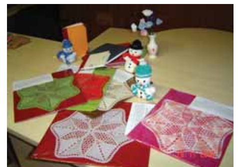
Izdelki iz delavnic DU Lukovica na Ekološkem sejmju