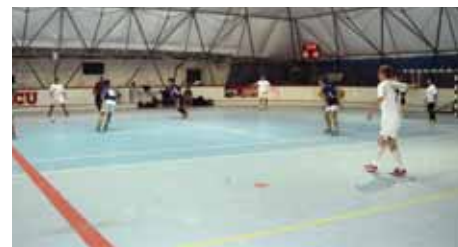
BS Tehnik je uspešno branil rezultatsko prednost

Iz uvodnih tekem nadaljevanja med drugim velja omeniti klasičen derbi zadnjih let, ki se je končal z visoko zmago BS Tehnika nad trojansko ekipo Cosmos Antimon z rezultatom