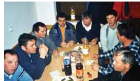
Druženje po končanem občnem zboru (arhivski posnetek)