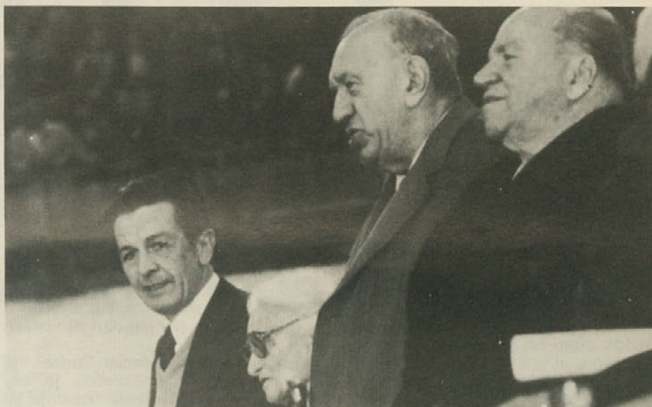
Berlinguer, Camilla Ravera, Roasio in Vittorio Vidali na predsedstvu ob proslavi 60. obletnice ustanovitve KPI.

V šestdesetih in sedemdesetih letih je tržaška federacija KPI pogumno premostila posledice ločitve duhov v letu 1948. Ponovno je bila združena napred-