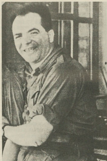
Vidali, soustanovitelj 5. regimenta.

Vidali je vojna leta preživel v Mehiki, kot tudi drugi španski borci in kulturni delavci. Z njim je bila furlanska umetnica Tina Modotti, na katero ga je vezalo intimno prijateljstvo. Njena prerana in nepričakovana smrt je bila zanj hud udarec, kajti Vidal ni bil samo neustrašen borec, pač pa tudi človek burnih in ognjevitih čustev, ki je ljubil življenje, čeprav mu ni nudilo trajnih užitkov.