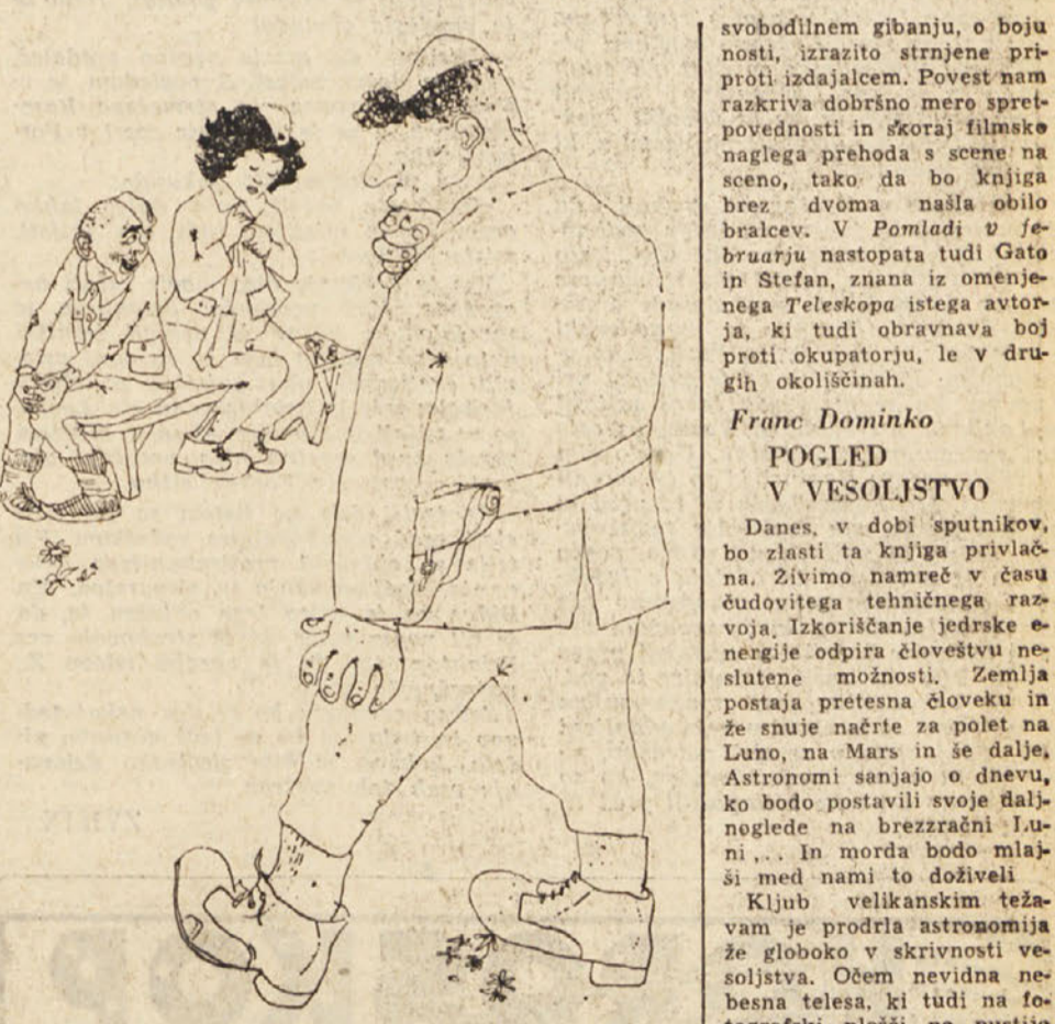
Ilustracija iz Branka Čopiča Doživljajev Nikolettine Bursaca; ilustriral Zulfikar Džumhur