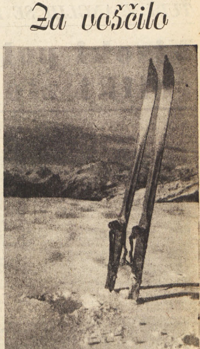
Vsakdo se bo razveselil, če bo prejel za voščilo lepo fotografijo mikavnega zimskega motiva. Veliko izbirnih tahifotografij ima na razpolago Tržaška knjižgarna v Ul. sv. Frančiška št. 20.