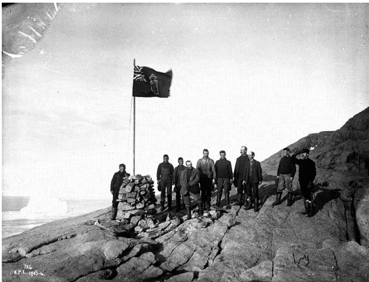
Lever du drapeau, Cap Herschel, île d'Ellesmere, T.N.-O. [Nunavut], [le 11 août 1904] 23 Cette photo entend confirmer la souveraineté canadienne dans les îles de l'Arctique.