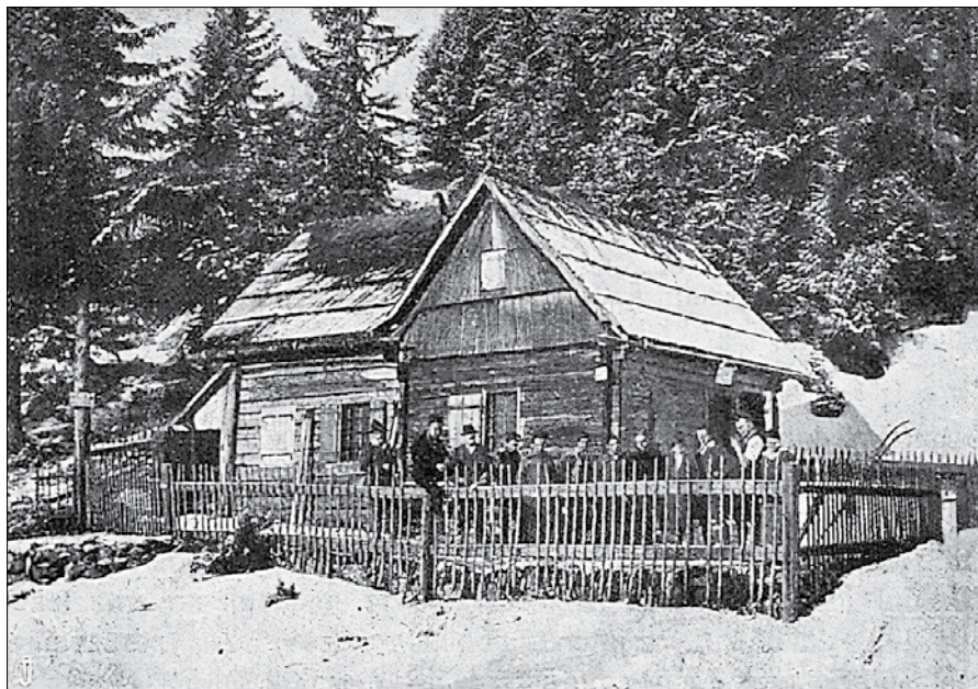
Mozirska koča leta 1922

V dobi, o kateri govorimo , to je pred prvo svetovno vojno, je imel vsak deležnik skupne radegundske planine svojega pastirja, ki je pasel drobnico; skupnega volarja, ki je pasel govejo živino, pa je moral priskrbeti vsako leto