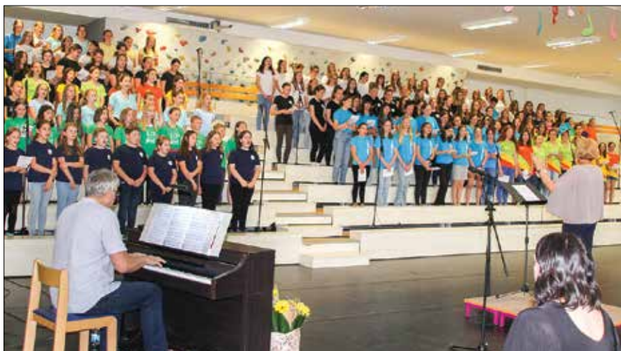
Pri vsaki pesmi združenega zbora se je zamenjal zborovodja, za spremljavo je poskrbel Toni Acman.