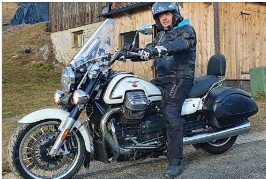
»Delo je polno pritiskov, ki pa nate vplivajo toliko, kolikor sam dovoliš.«

Ugled učiteljskega poklica je v upadaju. To je posledica odnosa družbe kot celote do določenih poklicev. Žal se učitelji ne znamo pravilno promovirati. Med šolskim letom opravimo veliko popoldanskih dejavnosti, priprav na tekmovanja, nastope in še mnogo je tega, s čimer pokrijemo ure, ko smo doma med počitnicami. Res je, da se o nas največ govori, ko gre za plače, počitnice in še kaj, se