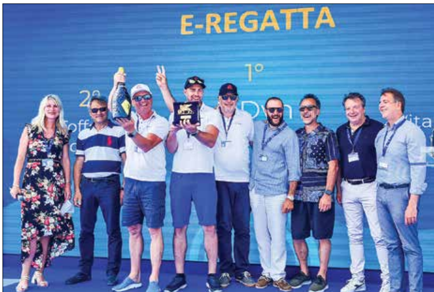
Podkrižnikova ekipa je s čolnom e'dyn 1120 - tako kot lani – premagala vse rivala.