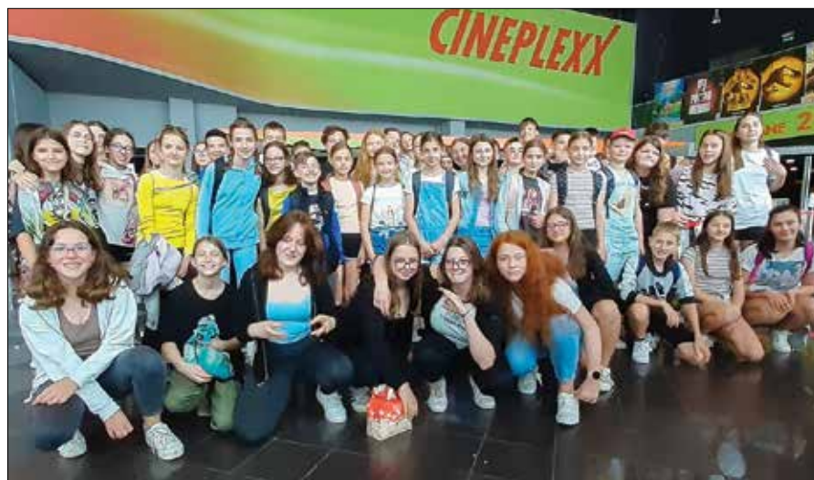
Bralni značkarji OŠ Nazarje v celjskem Cineplexxu

V letošnjem šolskem letu so se učenci Osnovne šole Nazarje spet izkazali kot dobri bralci in ljubitelji pustolovščin. Potem, ko so preživeli aprilsko noč v šolski knjižnici, so se v petek, 27. maja, bralni značkarji od 6. do 9. razreda odpeljali v celjski Cineplexx in si ogledali film Vesolje med nami.