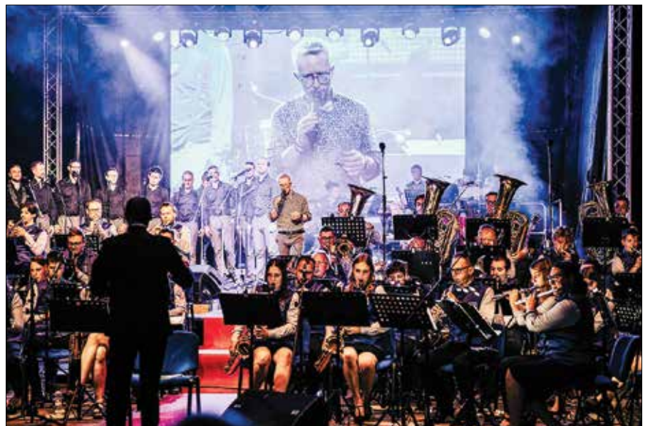
Nastopajoči so bili po koncertu deležni stojećih ovacij občinstva.