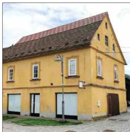
V prostorih nekdanje tehnične trgovine bo nastal muzej.

Občina Mozirje se je odločila za nakup nekdanje tehnične trgovine na mozirskem trgu. Mercator, lastnik