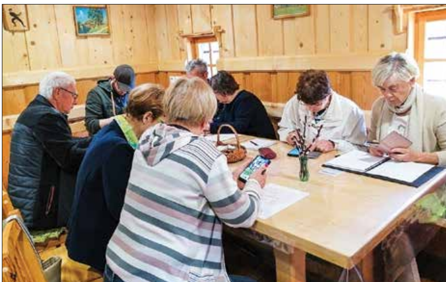
Ljubenski upokojenci so si pridobili nove veščine pri uporabi pametnih telefonov.