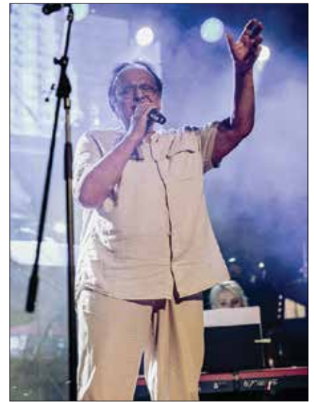
Oto Pestner je napovedal, da se na Ljubno ob Savinji še vrne.

skega glasbenika je tudi, da enkrat stopi na oder z Otom Pestnerjem, in ponosni smo, da smo lahko prepevali s takšno legendo. Občutki po koncertu so nepopisni, energija na odru je bila sproščena, hkrati pa je bilo malo treme. Veselimo se še kakšnega sodelovanja