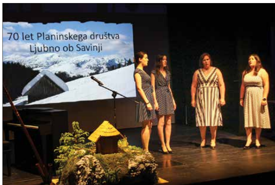
V kulturnem programu so nastopile tudi pevke Kvarteta Štiglic.