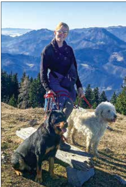
Obožuje slovenske planine.

Pred šestimi leti se je vse spremenilo. Začelo se je z bolečinami v mišicah in sklepih, po dveh letih preiskav so zdravniki ugotovili, da je zbo-