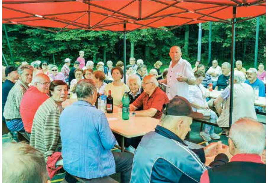
Bočki upokojenci so se v velikem številu zbrali na občnem zboru.