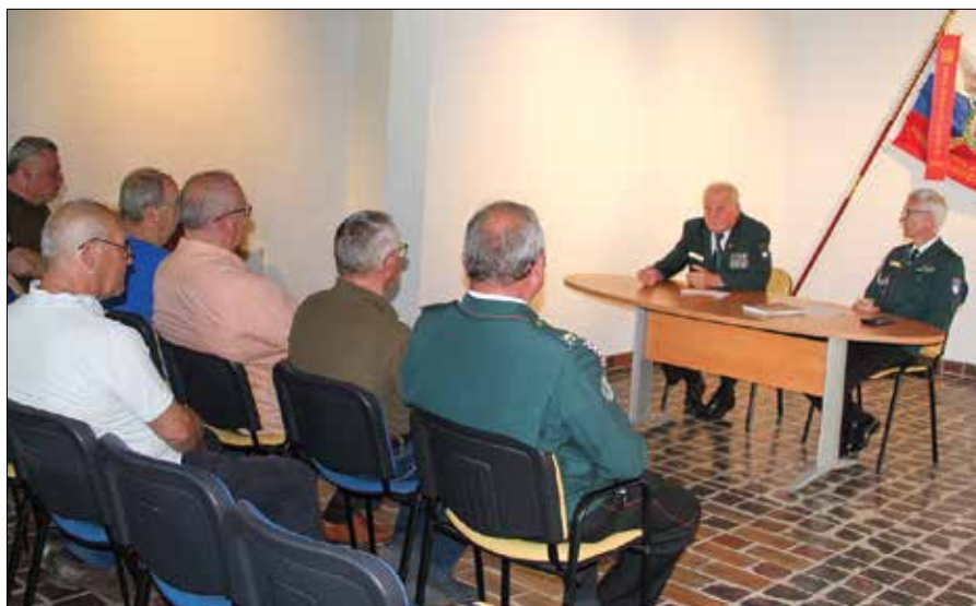
Udeleženci večera so izvedeli veliko zanimivih podrobnosti iz časa osamosvajanja Slovenije.