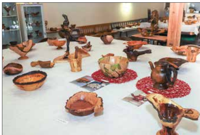
Lesene figure so najrazličnejših oblik in velikosti.