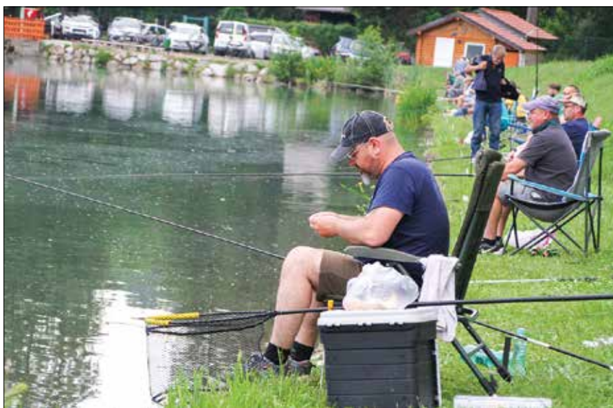
Vsaka ulovljena riba je tekmovalcu prinesla točko.