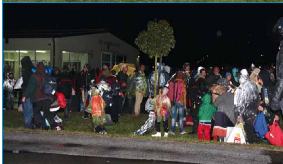
Torkovo jutro pred Kmetijsko zadrugo v Markovcih.

vedo vse pomembne podrobnosti in ne skrivajo svoje namere, da so njihov cilj le socialno močne države, kot so Nemčija, Švica in Švedska, skoraj vsi imajo navigacijske sisteme in polno raznih sodobnih pripomočkov, imajo tudi ogromno denarja ... Nekateri. Spet imamo drugo skupino ljudi, ki so revnejši, ki so zadovoljni že s kosom kruha in skodelico mleka, s kakim sendvičem in s streho nad glavo. Po spremljanju vseh medijev ugotavljajo, da vse, kar v eni državi dobijo, v drugi potem mečejo v stran. Hrano tudi zavračajo, kar pomeni, da niso tako lačni.«