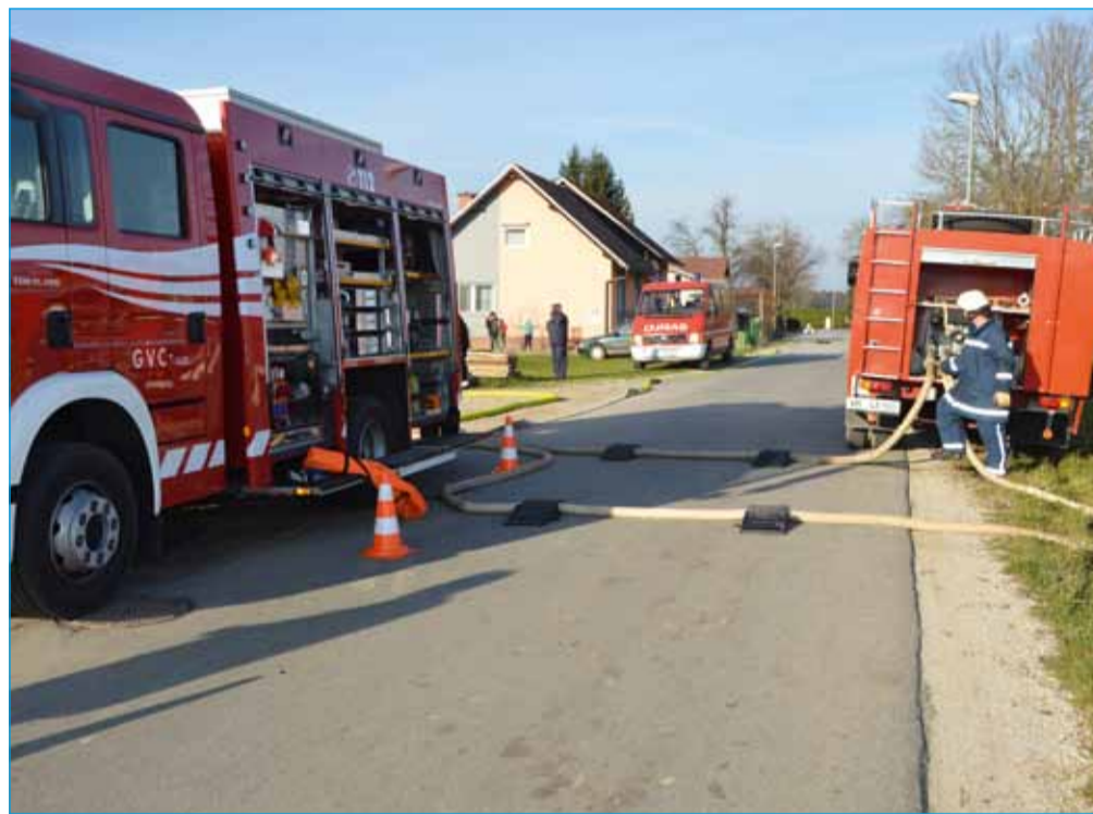
Vaja – gašenje požara

Vedno znova želimo prebivalstvo opomniti na nekaj ključnih momentov, ki so odločilni za uspešno intervencijo gasilcev. Če se osredotočimo na letošnjo temo meseca požarne varnosti, je