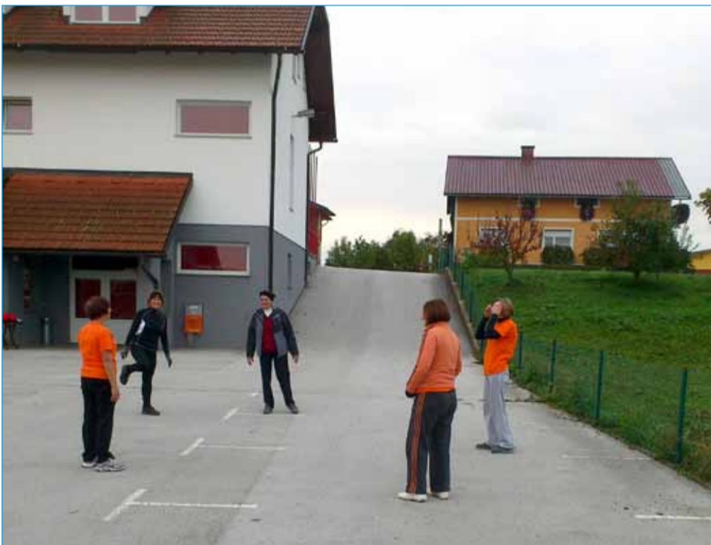
Število udeležencev se z vsakim dnevom veča