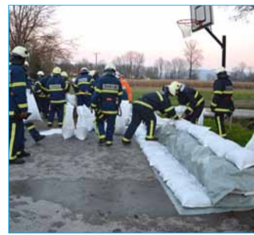
Gradnja protipoplavnega nasipa