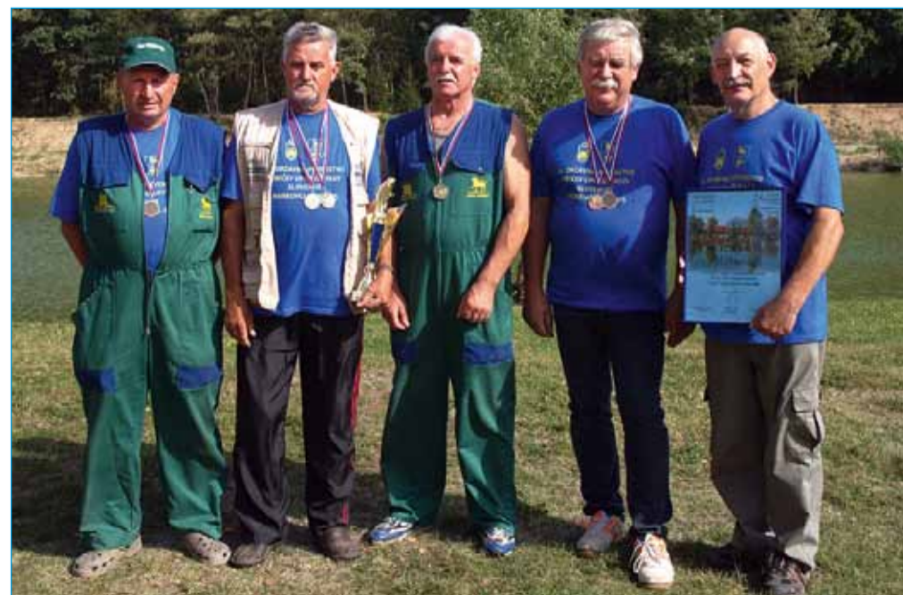
Ekipa DU Markovci s predsednikom društva