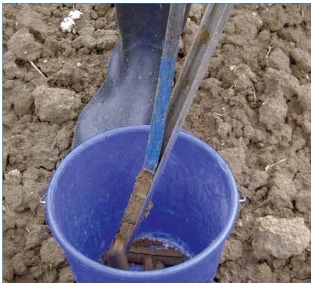
Odvzem vzorca zemlje s sondo

Območje pH, v katerem najbolj uspevajo vrtnine, je od 6 do 7. Kar je nad 7, označuje bazična tla, apnenje je prepo-