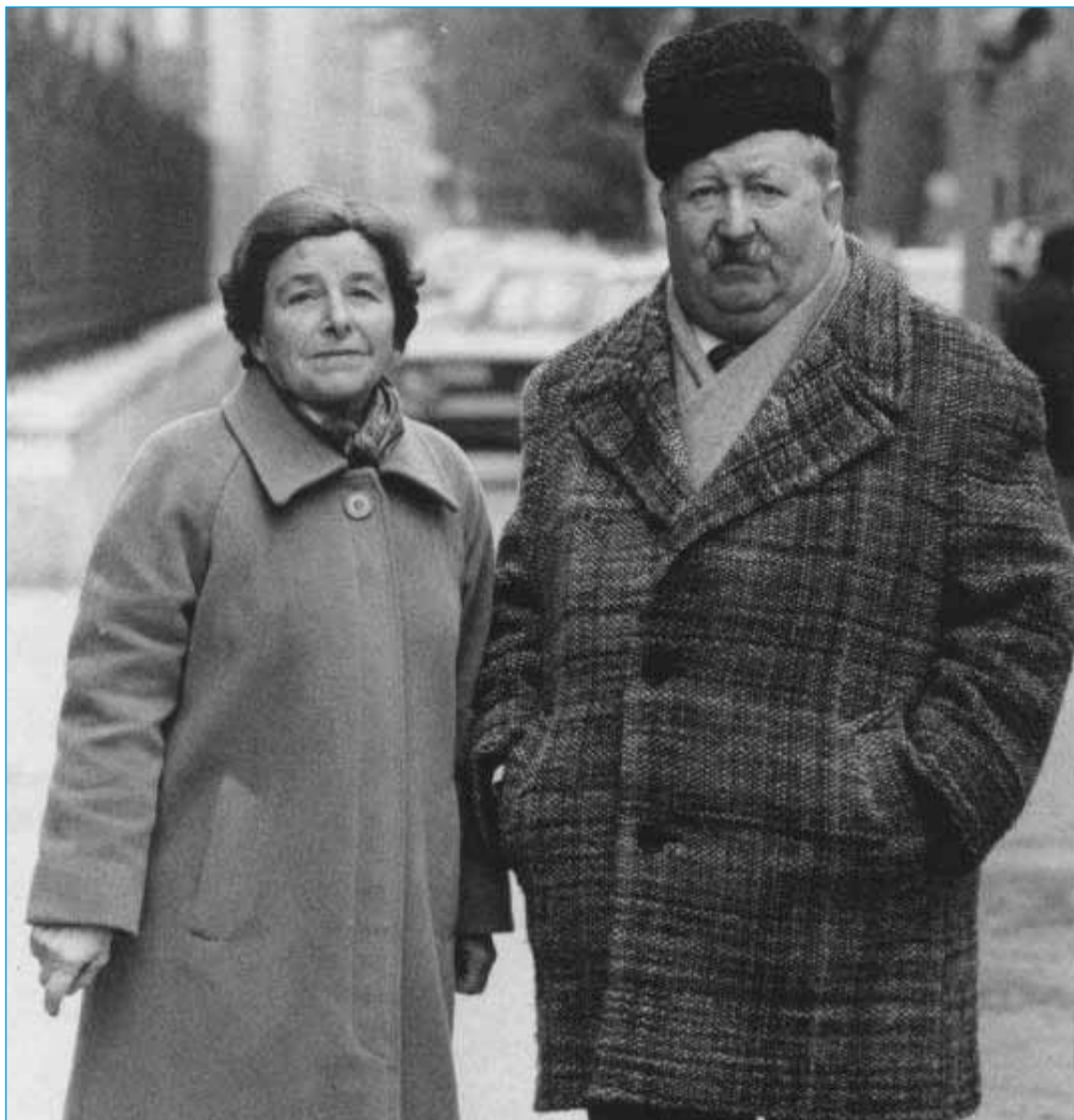
Branka Jurca s soprogom Ivanom Potrčem (80. leta 20. stoletja)