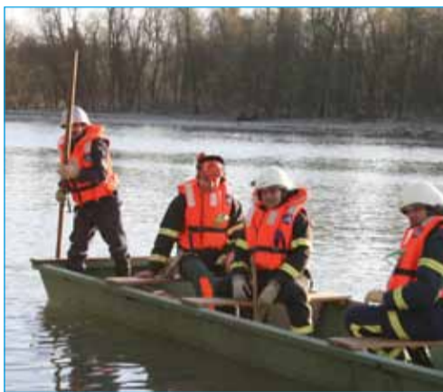
Vaja – reševanje na vodi

Natisnjenih in razdeljenih je bilo čez 100.000 zgibank za celotno Slovenijo.