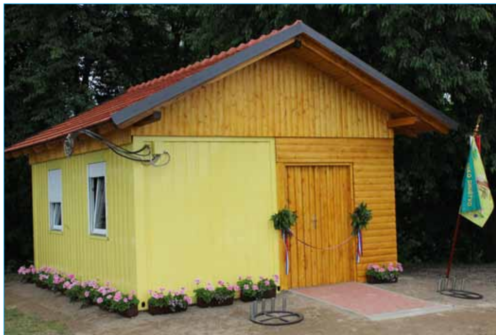
Novi prostori ČD Markovci

Zadnjo soboto v juniju so člani Čebelarskega društva (ČD) Markovci proslavili 80-letnico delovanja društva. Ob tej priložnosti so namenu slovesno predali nove prostore, ki bodo služili za različna čebelarska opravila, najbolj pa za točnejše medu v spomladanskih in poletnih mesecih. Gre za objekt v velikosti dobrih 30 kvadratnih metrov. Vanj so veliko dela vložili člani in simpatizerji društva.