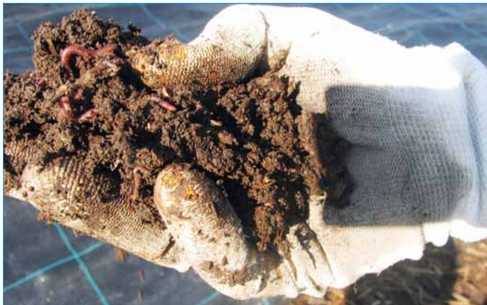
Živa zemlja je rodovitna zemlja.

Zelo pomemben je tudi pravilen odvzem vzorca. Najlažje to naredimo s sondami, ki si jih lahko izposodimo v laboratorijih za analizo tal. Lahko uporabimo tudi lo-