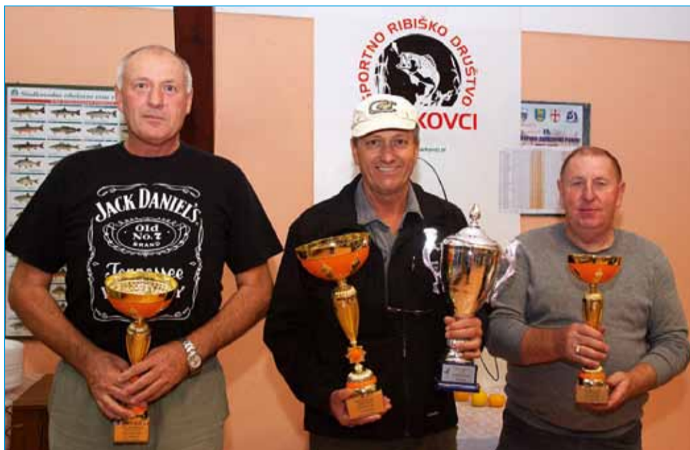
Prvi trije tekmovalci v jesenskem delu lige 2015