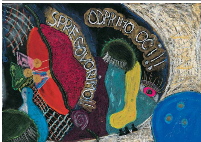
Eva Lupše, I. OŠ Žalec, Žalec

»Odprimo oči! Spregovorimo! Odprimo oči, spregovorimo o težavah in jih rešimo. Pomembno je težave rešiti, predvsem sproti, ne o njih samo debatirati ...«