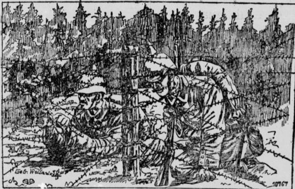
Vojaki režejo sovražne žične ovire.

»Je, je nekaj,« reče župnik mirno, »in vem tudi kaj. Ni mi treba nič tajiti. Kar je poštenega — in tvoja namera, da hočeš