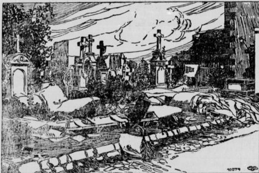
Pokopališče po vojski.