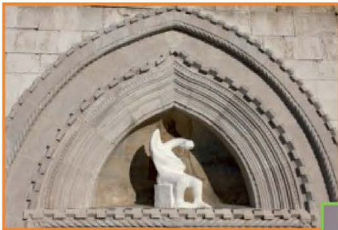
Tako si Marijino vnebovzetje v timpanonu koprške stolnice zamišlja Lan Seušek

mnoga vprašanja. Ali ta kip omogoča dojemanje Boga, Radikalno Drugega? Kajti to je oziroma bi moral biti temeljni namen