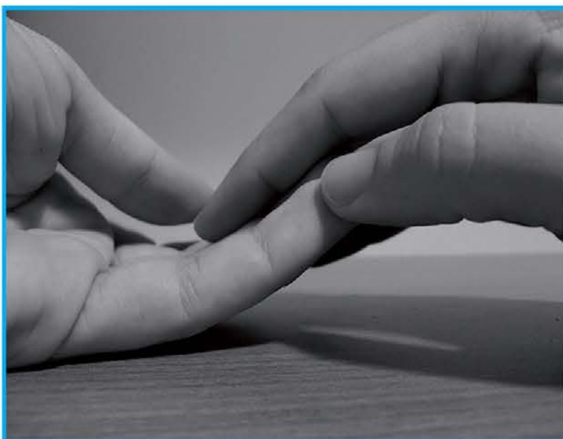
Kdor je dobil dar nežne ljubezni v svoji družini in skupnosti, jo more razvijati in podarjati naprej. Kje naj se naučimo nežnosti? Prav gotovo v družini in v skupnosti, zlasti v Cerкви.

te ljubezni. Zlasti vzhodni teologi poudarjajo, da sta pri prihodu na svet pričakala mati Marija in prijatelj, Janez Krstnik. Jezus je deloval v moči nežnosti, še posebej, ko se je sklanjal k ubogim in h grešnikom, zlasti pa, ko je vzel nase ves greh in hudobijo človeštva, da bi jo s svojim trpljenjem, ljubeznijo in odpuščanjem spremenil v dar življenja in odpuščanja. Kot spomin na svojo nežnost je učencem dal zapoved ljubezni in postavil zakramente, da bi se skozi čase