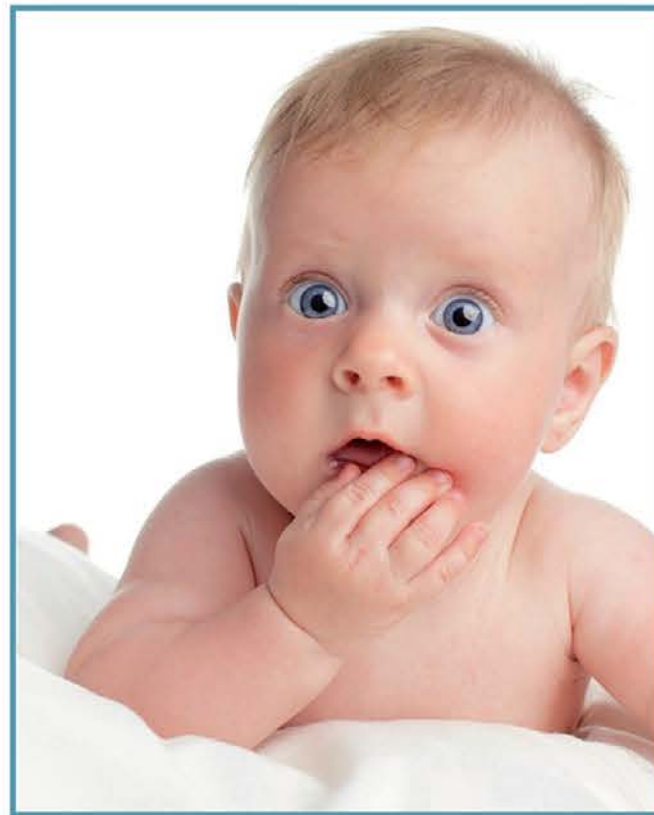
Danes ljudje ne znamo več živeti v realnosti, ampak od nje bežimo. Odpovedujemo se tudi, zelo na lahek način, zakladnici izročila.

britanskega jezikoslovca in književnika, je – po mojem skromnem mnenju – zlasti dvoje, kar kot težavo opažam tudi sam. Prva zadeva je nerealnost ljudi. Sir John Ronald v svojih delih namreč nikdar ni bežal iz resničnega sveta, ampak je le-ta skrit pod patino fantazijskega jezika. Zadeva je, če dobro pogledamo, zelo podobna zadnji knjigi Nove zaveze, kjer je še kako resnični svet opisan v apokaliptičnem jeziku. V obeh primerih gre za svet, ki je resničen, a ni nujno fizičen – prej metafizičen. Gre torej za stvari, ki so resnične, a presežne. Tolkien je svoja dela napisal zato, da bi človek postal bolj realen, ne manj. Želel je, da bralec prevzame nase odgovornost in se poda na zahtevno življenjsko pot, kot to velja za Froda v Gospodarju prstanov ali za Bilba v Hobitu, ki smo ga imeli nazadnje priložnost gledati. Želel je, da bralec bolj polno okuša resničnost življenja, ne pa, da beži od nje. Ta beg od resničnosti je žal danes nekaj zelo pogostega. Vsak od nas pa, vsaj malo, beži – na tak ali drugačen način. Dela, kakršna so te velike stvaritve britanskega akademika, nam lahko pri trudu za polno življenje vsekakor pomagajo, a pod pogojem, da jih ne jemljemo z levo roko kot zgolj fantazijsko literaturo. Druga zadeva je "izročilo", ki mu s tujko rečemo "tradicija". To je tisto, kar se je v