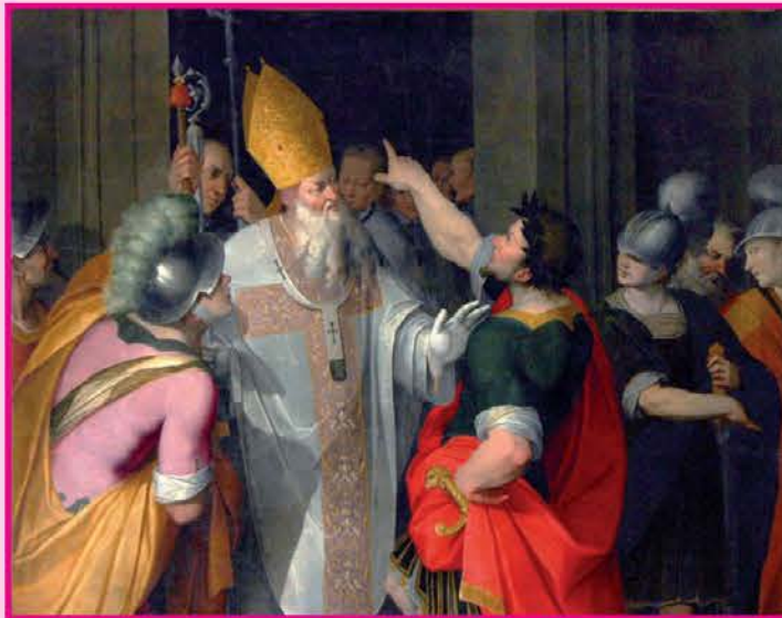
"Zgled je lahko sv. Ambrož, ki ni dovolil, da bi cesar Teodozij prejel sv. obhajilo, temveč je moral delati javno pokoro, ki je bila takrat v veljavi."

loga. Zgolj stereotip je, da se liberalci ne bi mogli zavzeti za pravice katoličanov, ko bi bilo izpovedovanje njihove vere ogroženo. Nasprotno, to je nujno, sicer niso več liberal-