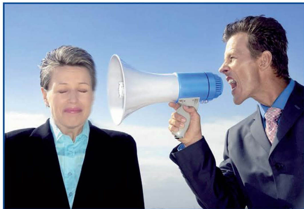
Ena izmed vrst monologa je vpitje, ki ga lahko primerjamo z grehom. Tako kot vpitje prinese razdor med dva, ki se prepirata, tako je greh prelom občestva z Bogom.

Vpitje nadalje pomeni, da je nekaj vidno zaradi kontrasta z okoljem, ali pa, da se pojavlja v visoki in močni obliki. V mestih je bil velik greh, pojavil se je v izredno močni in razširjeni obliki in prav nič drugače ni danes. Tudi naša mesta vpijejo. Vpijejo pa tudi zato, ker je greh vedno kontrast okolju, še več, kontrast je človeku samemu. Beseda, ki ne spada v naš slovar življenja. Naše stvarstvo je namreč po besedi Boga samega "dobro" in človek