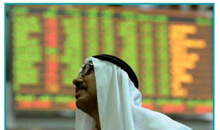
Muslimanska vera prepoveduje zaslužek denarja z denarjem, vendar tudi omogoča dobiček, potem ko denar preide iz monetarne v ekonomsko funkcijo.