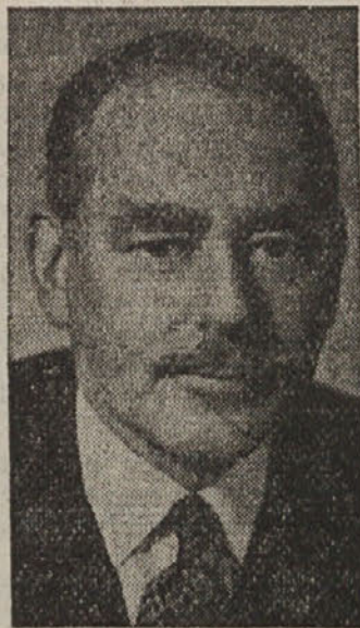
Zunanji minister Dean Acheson

Z ozirom na bojazen nekaterih evropskih držav zaradi zopetne oborožitve Nemčije je dejal predsednik zunanjepolitičnega odbora: „Razumemo dobro nezaupanje Francije do Nemčije, vendar pa je treba pomisliti, da nevarnost za zapadno Evropo ni na drugi strani Rena, ampak ji grozi ta nevarnost z vzhodnega brega Labe.“