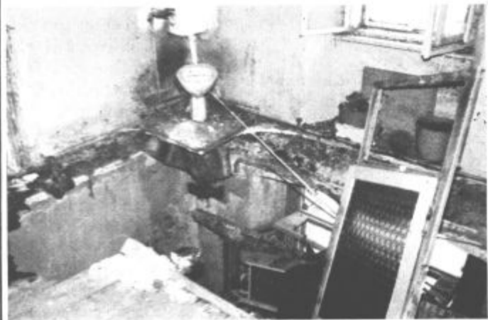
Od kopalnice in sanitarij je ostala le školjka

sem dobil odgovor, da ga drugi še bolj potrebujejo. Tudi po tem dogodku sem potrkal na ustrezna vrata in dobil podoben odgovor. Gospod, mi vam ne moremo pomagati. Stanovanj ni. Vem, da bi se še našlo kakšno prosto stanovanje in bi mi ga lahko dali v najem, seve-