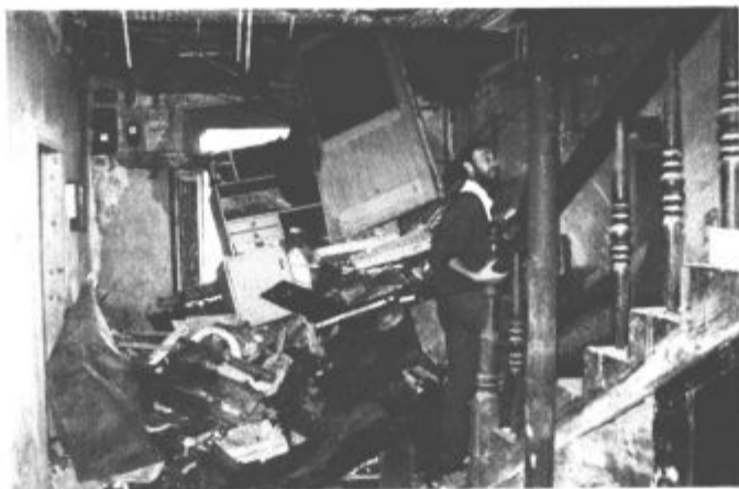
Si upate tu hoditi?

Ni treba, da si izvedenec za to področje ali kakšen inšpektor pa