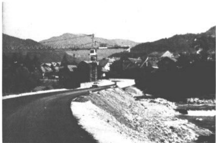
Z obvoznico se bo na Ljubnem marsikaj spremenilo

ljudi ter izzival narave. Delavci Primoreja iz Ajdovščine dela opravljajo v skupno zadovoljstvo, kakovostno in v predvidenih rokih. Te dni opravljajo zaključna dela z asfaltiranjem obvoznice vred. Vse bo sklenjeno do konca tega meseca, potem bodo sledili tehnični pregledi in ostale formalnosti do uradnega odprtja enkrat v oktobru, pred tretjo "obletnico" torej. Obenem bodo sklenjena dela na pritoku Ljubniva, vključno z novim Batlnovim mostom, začasni vojaški most preko Savinje pa bodo odstranili.