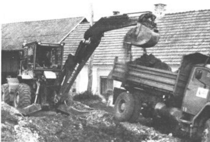
Ob asfaltiranju ceste v Rovt so se prebivalci Brda trudili s spodnjim ustrojem

Zadnji dosežek je torej povsem posodobljena cesta od Šmartnega do Lipe. Nova cesta z asfaltno prevleko na 4,8 kilometrih je močno izboljšala povezavo z Vranskim, še več pa je vredno, da so se z njo oddolžili krajanom Rovta za njihovo doseganje solidarnost pri uspehih v