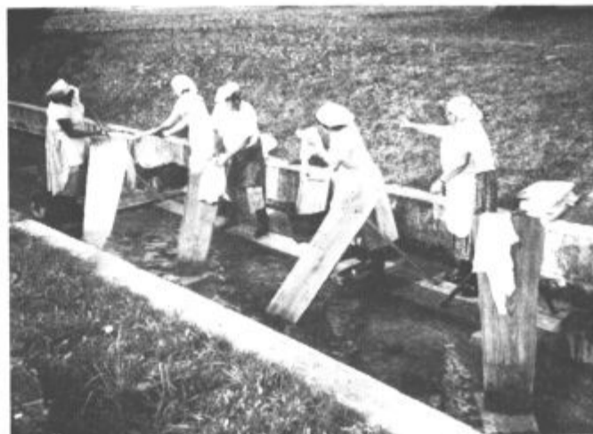
Topolške perice - turistični simbol kraja - na letosnji prireditvi Veselje ob Topolšici

kraju ni le dejavnost hotela Vesna, ampak tudi življenje in delo krajanov, njihova "naklonjenost" tej dejavnosti, je veliko. Predvsem pa nezane-marljivo".