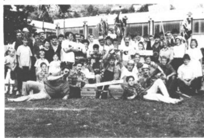
Gasilski posnetek vseh sodelujočih (v ospredju zmagovalna ekipa Velikega Vrha)

Ob tekmovalcih in tekmovalkah velja omeniti še povezovalca