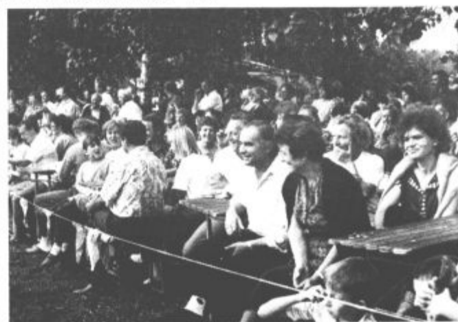
Bilo je zanimivo in prijetno

Kot za stavo so opravili tekmovalke in tekmovalci iz Slatin, Podgore, Velikega in Malega Vrha.