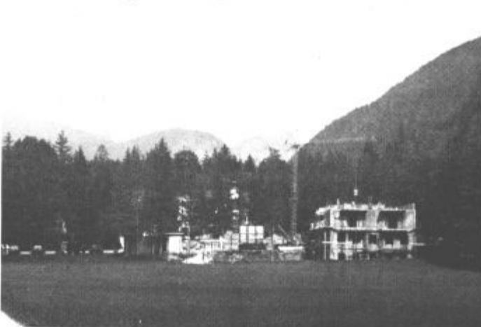
...danes (jutri) pa sodoben hotel z bazenom