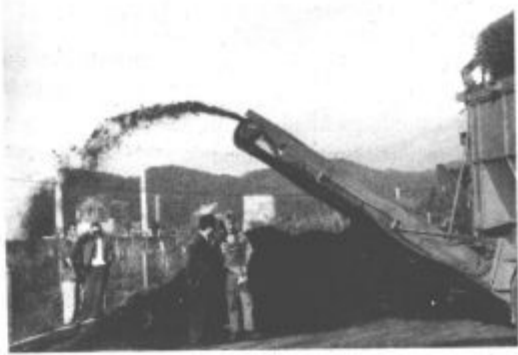
Poskusno sejanje komposta na odlagališču bio odpadkov je bilo uspešno

odpadkov že lahko rečemo, da smo na pravi poti in bioloških odpadkov ne bomo več zavračali. Za primerjavo naj povem, da pridobimo približno 60 odstotkov komposta, ostalo so odpadki. Seveda bomo kompost takoj poslali v analizo, da ugotovimo njego-