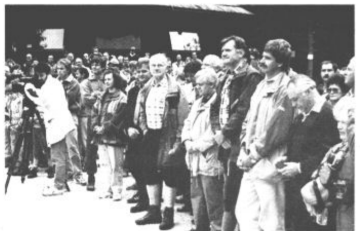
Ob predsedniku in drugih gostih so bili tudi sorodniki obeh velikih mož

Za konec pa tole. Prijetna slovesnost je vsaj pri domačinih pustila trpek občutek. Sredi