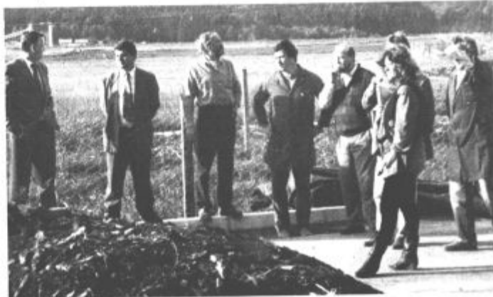
Obiskovalci so z zanimanjem opazovali delo stroja

pinj, po nekaj tednih pa je padla na 30, kar je pomenilo, da moramo kompost premešati, s tem dodati večjo količino kisika in kompost celo pokriti. Tako se je mikroorganizem povečal, povečalo se je tudi razkrajanje. Tudi črvi so izginili, prav črvi pa so pokazatelj, da se bio odpadki pospešeno razkrajajo. Po sedanjem poskusnem sejanju komposta od drugih