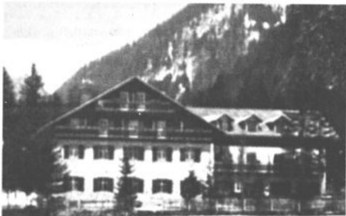
Planinski dom kot "zaščitni znak" nekoč...