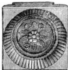
Pod. 6. Okroglo tvorilce z obrobkom.

Maslo, ki ga vzamemo iz tvorilca zaviti moramo v pergamentni papir, ki se dobi v vsaki trgovini papirja (n. pr. Jeretič v Gorici) za male novce. Časniški papir pušča v maslu črnilo, kar pač ne vpliva