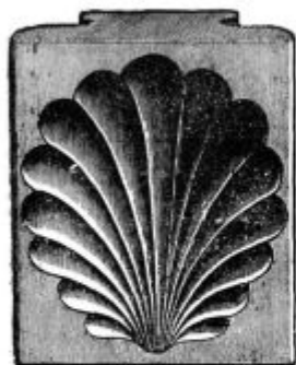
Pod. 5. Školjkasto tvorilce.

Kedar stavimo maslo v tvorilca, ne sme biti ne pretirno, pa tudi ne prem hko. V prvem slučaju se noče vtisniti, v drugem slučaju pa se prijemlje tvorilca in ga ne moremo spraviti radi teža iz njeza. S pomočjo mlačne vode zamoremo maslo primerno vgreti, da se bo to dalo lepše tvoriti. Tvorilce moramo pred rabo oprati v morni vodi.