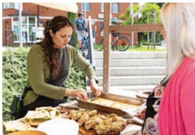
Dišalo je po srednjeveški hrani.

sionalci. Gre za sklop projektov in dogodkov, ki predstavljajo potencial za razvoj kulture tako v lokalnem okolju kot tudi širše, za raziskovanje, snovanje in opazovanje novih programov ter nadgradnjo starih, za povezavo kulturne dediščine z bolj popularnimi, zabavnimi vsebinami za otroke in odrasle. Festival sledi strategiji razvoja kulture v občini Medvode, ki je bila sprejeta pred dvema letoma,« je pojasnila Sabina Spanjol, koordinatorka in organizatorka kulturnega programa v Javnem zavodu Sotočje, pod okriljem katerega je festival potekal. Trajanje in obseg festivala sta se skozi leta spreminjala. Letos je trajal osem dni, kar je manj kot lani, program pa je bil zato še bolj strnjen. Sodelovalo je 28 organizacij in kar nekaj profesionalcev in prostovoljcev. Z več različnih zornih kotov so obravnavali legende.