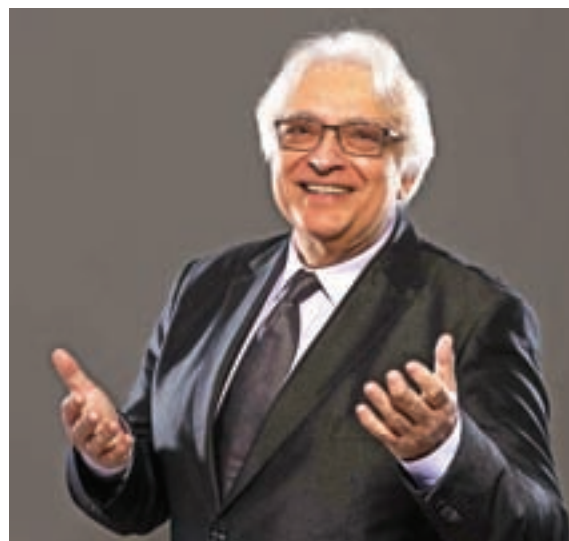
Na Večeru slovenske popevke z Godbo Medvode in gosti bo kot solist nastopil tudi Oto Pestner.

Večeru slovenske popevke bodo sledili Fast X kino na tržnici (24. junija), Karavana okusov (8. julija na tržnici), koncert Nine Pušlar z odprtjem kolesarske brvi (8. julija na tržnici), zato bo vstop prost, film Indiana Jones in artefakt usode (22. julija na tržnici), klapski večer Šufit in Solaris (23. julija na tržnici), festival Wild West Fest ob Zbiljskem je-