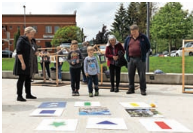
Festival je namenjen vsem generacijam.