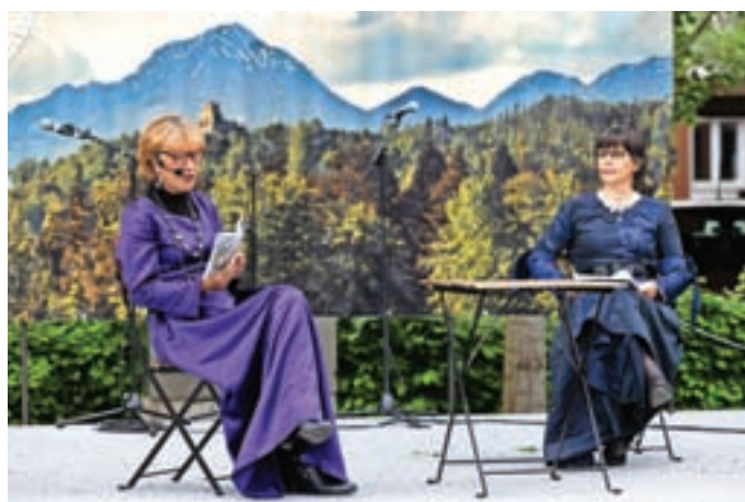
Na odru so pripovedovali tudi legende. / Foto: Peter Košenina

Organizatorji napovedujejo, da bo festival ostal tradicija in da bo potekal tudi prihodnje leto.