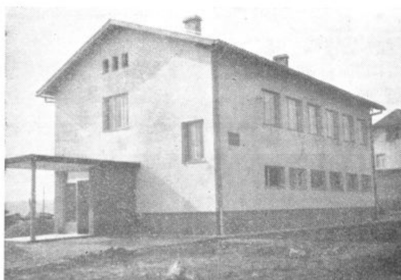
Upravno posloplje lenarškega gradbenega podjetja na Radgonski cesti

Podjetje napreduje. Največji »greh« — nagrajevanje po učinku, pa se bo, kakor kaže, kmalu popravil, tako da bodo delavci resnično plačani po vložnem delu.