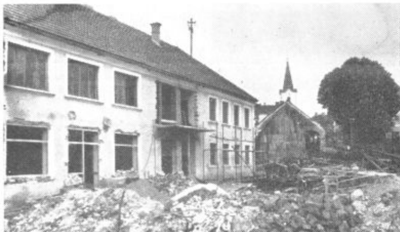
ZADRŽNI DOM OBNAVLJAJO — V Cerkevniku so v teku zaključna dela pri obnovi zadržnega doma. Na sliki: zadržni dom med obnovo

Dela izvaja gradbeno podjetje Gornja Radgona. Po pogodbi, ki jo je sklenilo Trg. podjetje »Izbira« Cerkevnik z gradbenim podjetjem, naj bi bil cerkevniški zadržni dom dokončno obnovljen 1. julija letos. Odprli pa ga bodo za občinski praznik.