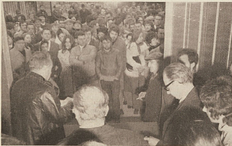
25. aprila na Opčinah. Protifašistične manifestacije, ki jo je priredila komunistična partija, se je udeležilo mnogo ljudi iz mesta in podeželja. (Poročilo o manifestaciji objavljamo na 3. strani).

Slovenske delavske in demokratične množice se bodo ob Prvem maju še tesneje združile z veliko demokratično in protifašistično fronto, zavedajoč se, da je to edino pravilno, saj je enotnost predpogoj za zmago pravice. Komunisti bodo, kot vselej, tudi tokrat dali svoj delež za dosego tega cilja.