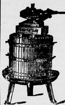
Stiskalnica za vino.