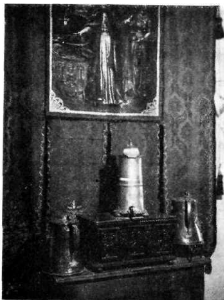
Pogled v del etnološke zbirke v Puštalskem gradu, kjer je bil muzej od leta 1946 do 1959