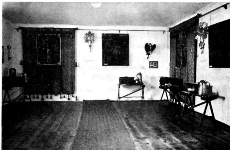
Prvotna postavitvev cehovske zbirke na loškem gradu po letu 1959