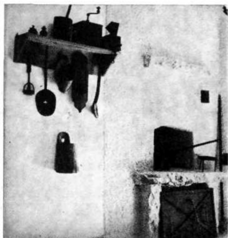
Prikaz »črne kuhinje« v prvem nadstropju današnjega muzeja