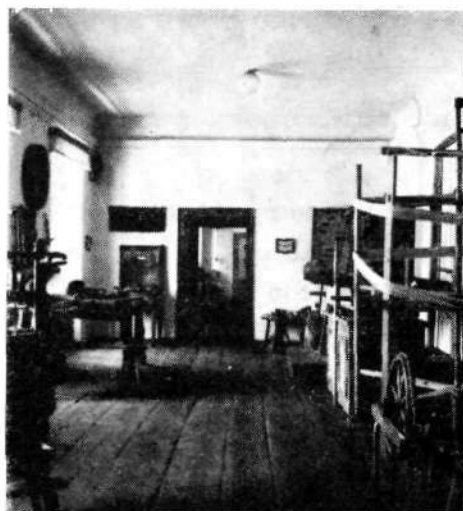
Prva postavitvev cehovske zbirke v muzej-skih prostorih na Mestnem trgu leta 1939