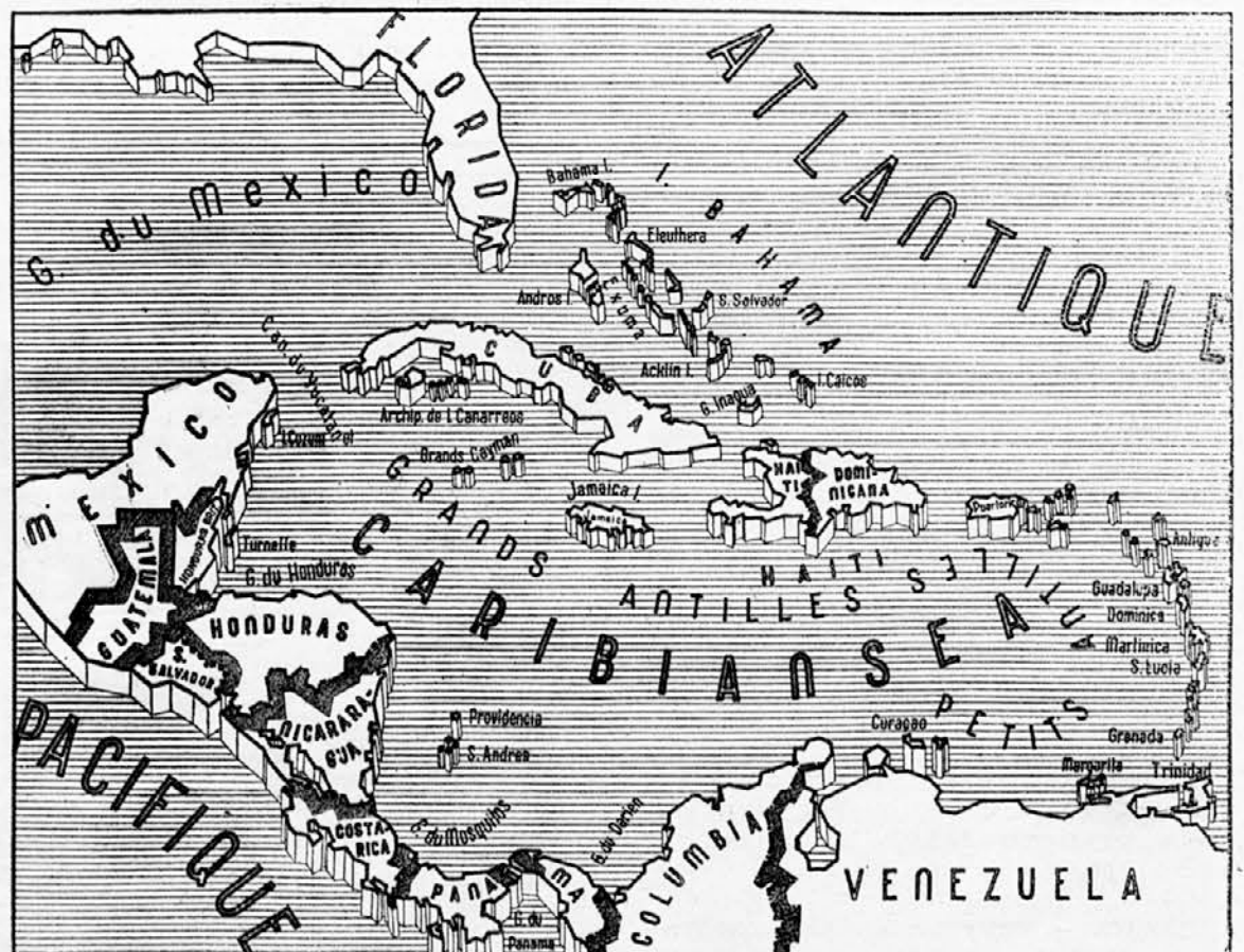
Kjer delujejo osovinske podmornice.

Angleško letalstvo je preteklo noč napadlo Hamburg ter je metalo zažigalne bombe na stanovanjske dele mesta. Nočni lovci so skupno s protiletalsko obrambo sestrelili 5 sovražnik letal.