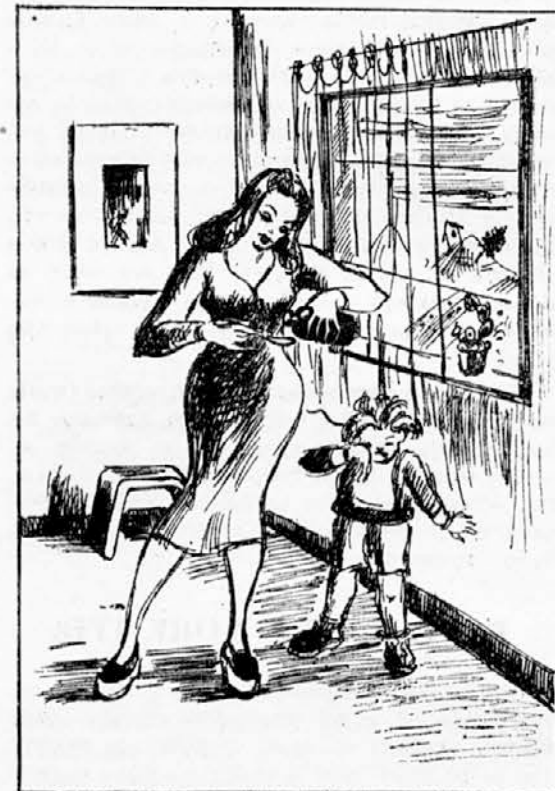
Če ne boš priden, pokličem Churchilla.

Na Kreti je sovražno letalstvo vrglo nekaj bomb, ni pa javljena nobena izguba.