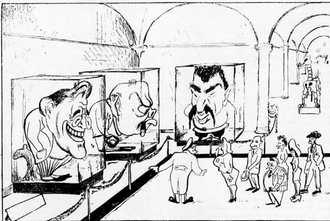
Muzej živali — Dvorana monstrov (strahov).