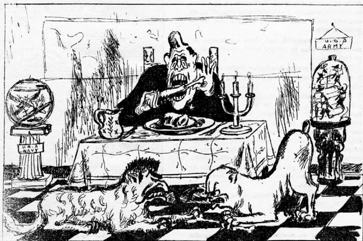
Kdo dobi prvo kost?

ADEN — V Adenu je bil dan znak alarma radi vesti, da so se opazile tri japonske podmornice v bližini luke.