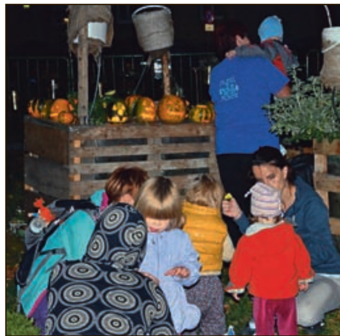
Ustvarjalne delavnice so bile v znamenju buč in jesenskih plodov, pravo veselje pa je nastopilo, ko so v prvem mraku pripravili razstavo s svečkami v bučah. S tem so začeli krompirjeve počitnice.

Že v petek, 25. oktobra, ko se je začel počitniški teden, so v lepem jesenskem popoldnevu poskrbeli za obuditev starega slovenskega izročila. To je že od nekdaj jesenski čas zaznamoval z izrezovanjem buč, v katerih so potem za dobro letino in srečo v družini prižgali svečke. Tako je bilo tudi tokrat; številne družine so izrezovale buče, otroci so ustvarjali tudi v ustvarjalnih delavnicah, ki so bile jesensko obarvane. Postregli so jim s pečenim kostanjem in sladkimi napitki, otroci pa so še posebej uživali, ko jih je obiskala čarovnica in ko so opazovali