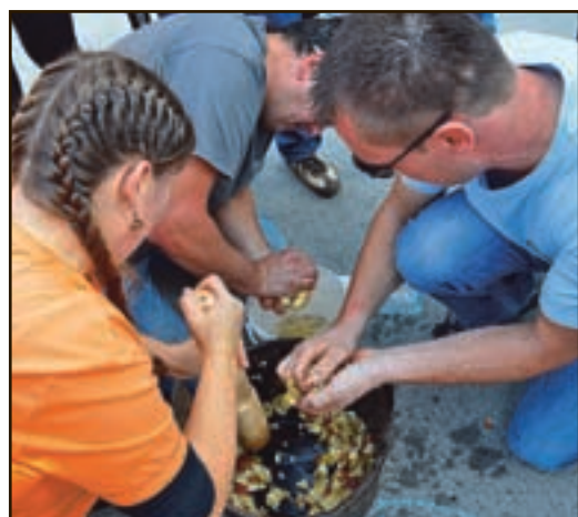
Jabolka so na šaljevem tekmovanju drobili ročno, kot v starih časih.

Po popoldanskem programu na Tolckariji je sledila večerna zabava z ansambлом Stil, ki so jo popestrili folkloristi folklorne skupine Koleda iz Velenja. Prireditev je tako uspeša, da sploh ne dvomimo, da ne bo