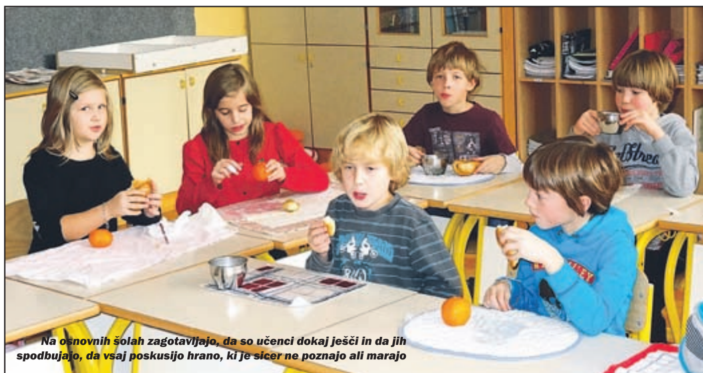
Na osnovnih šolah zagotavljajo, da so učenci dokaj ješčji in da jih spodbujajo, da vsaj poskusijo hrano, ki je sicer ne poznajo ali marajo

Na šolah pripisujejo razloge za manjše število subvencioniranih malic spremenjenim razmeram v družinah, zaradi katerih te niso več upravičene do te pravice. Še bolj pa predpostavljajo, da starši niso pravočasno oddali vlog za uveljavitev pravice na pristojnem centru za socialno delo.