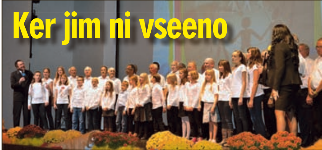
Dinamična, barvita, nostalgična in slikovita – takšna je bila po mnenju obiskovalcev prireditev ob 60-letnici Medobčinske zveze prijateljev mladine Velenje.

Osrednja prireditev ob 60-letnici MZPM Velenje začela tudi novo humanitarno akcijo zveze – Nostalgija in sedanost sta si podali roke v dobri želji za lepši vsakdanjik otrok