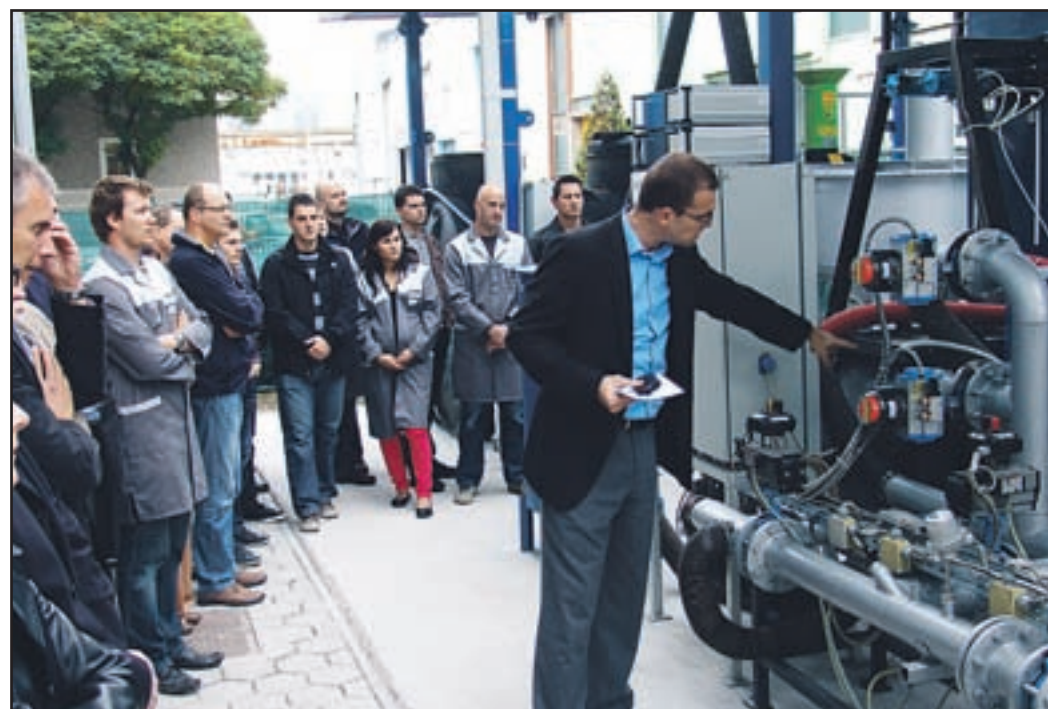
Učni poligon je na območju RCE.

Učni poligon sestavljajo bioplinška naprava s pripravo substratov, napravi za čiščenje žvepovega dioksida in TOC iz dimnih plinov, naprava za pripravo tehnoloških in pitnih voda ter pripadajoči laboratorij in merilna mesta.