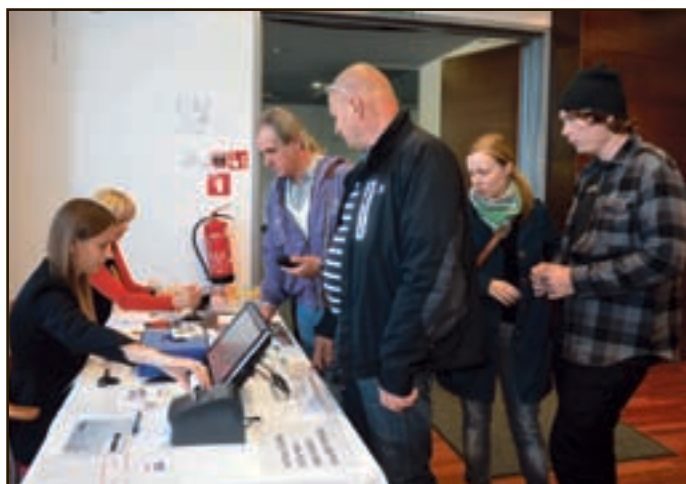
Vrsta za nakup osebne znamke in poseben poštni žig je bila ves čas prireditve dolga.

kulture Velenje, leta 2011 grad Šalek, lani Vila Bianca, letos pa Vila Herberstein, ki avtentično zaznamuje južno mestno obrobje Velenja. V vili je reprezentančni