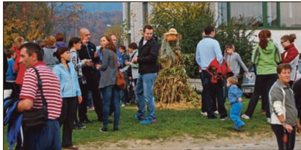
Druženje šolarjev in krajanov KS Šalek je bilo prijeto, zato bodo v prihodnje pripravili še več podobnih srečanj.

Vsem skupaj nam bo zagotovo ostala v spominu letošnja predstavitev krajevne skupnosti v oddaji na celjski televiziji, na kateri so se naši