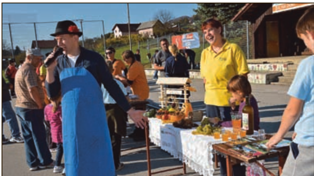
Tokrat so si vsi nazdravljali s tolckom. Mlajšim so točili letošnjega, starejšim je bolj prijal lanski.

Edina slovenska prireditev, na kateri se vse vrte okoli domačega jabolčnega napitka, navdušila obiskovalce in sodelujoče