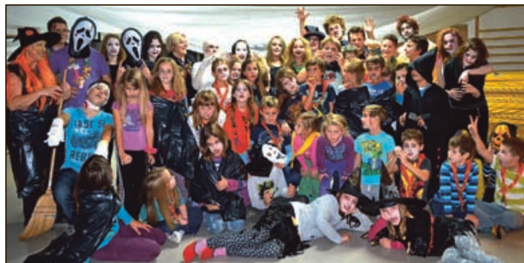
Zares je bilo zabavno.