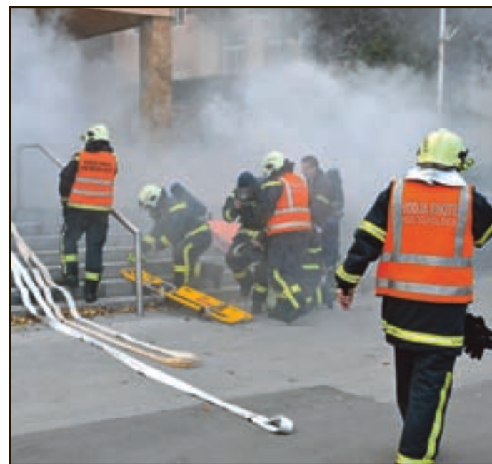
Vaja je v celoti uspela, ogledalo si jo je tudi veliko Šoštanjčanov.

Ob koncu je vodja intervencije Milan Roškar podal poročilo