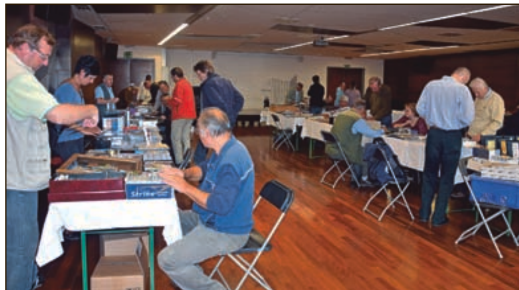
Čeprav je bilo razstavljalcev manj kot prejšnja leta, so zbiratelji uživali v pestri ponudbi.