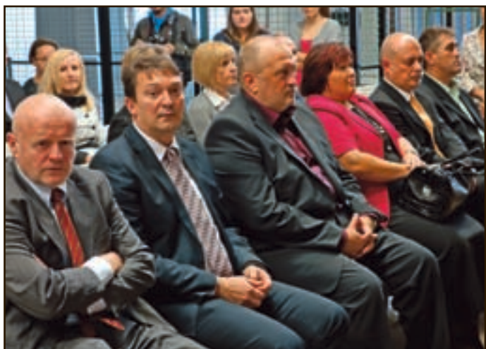
Slovesnosti ob jubileju

V Premogovniku Velenje so 24. oktobra v Muzeju premogovništva pripravili slovesnost, s katero so obeležili 60-letnico časopisa Rudar. V tamkajšnji Črni garderobi bodo vse do konca leta na ogled nekdanji izvodi Rudarjev. Prva številka je izšla januarja leta 1953.