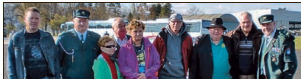
Šoštanjski veterani na slovesnosti ob odhodu zadnjega vojaka JLA

ki je med drugim poudaril, da smo od leta 1991 sami odgovorni za stanje v naši državi in se ne moremo na nikogar izgovarjati. "Na svoji zemlji smo mi gospodar, državo smo si priborili, kako z njo upravljamo, ne glede na vse težave in krizo danes živimo v miru in to mora ostati naša največja vrednota."