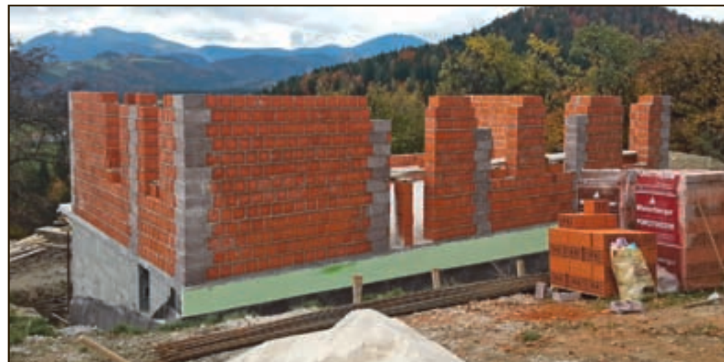
Gradnja napreduje.