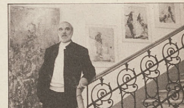
Najlepše darilo Mohorjevi ob 140-letnici — „Ustanova Valentina Omana“.