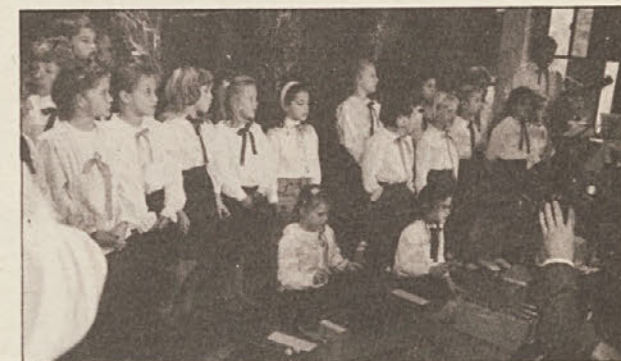
Otroci Mohorjeve ljudske šole so skupno z „Oktetom Suha“ oblikovali kulturni spored.