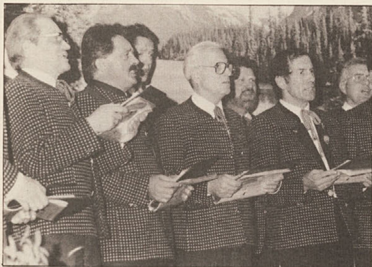
Gost je tokrat prišel z Nižje Avstrije. Predstavil se je MGVB Bad Fischau.