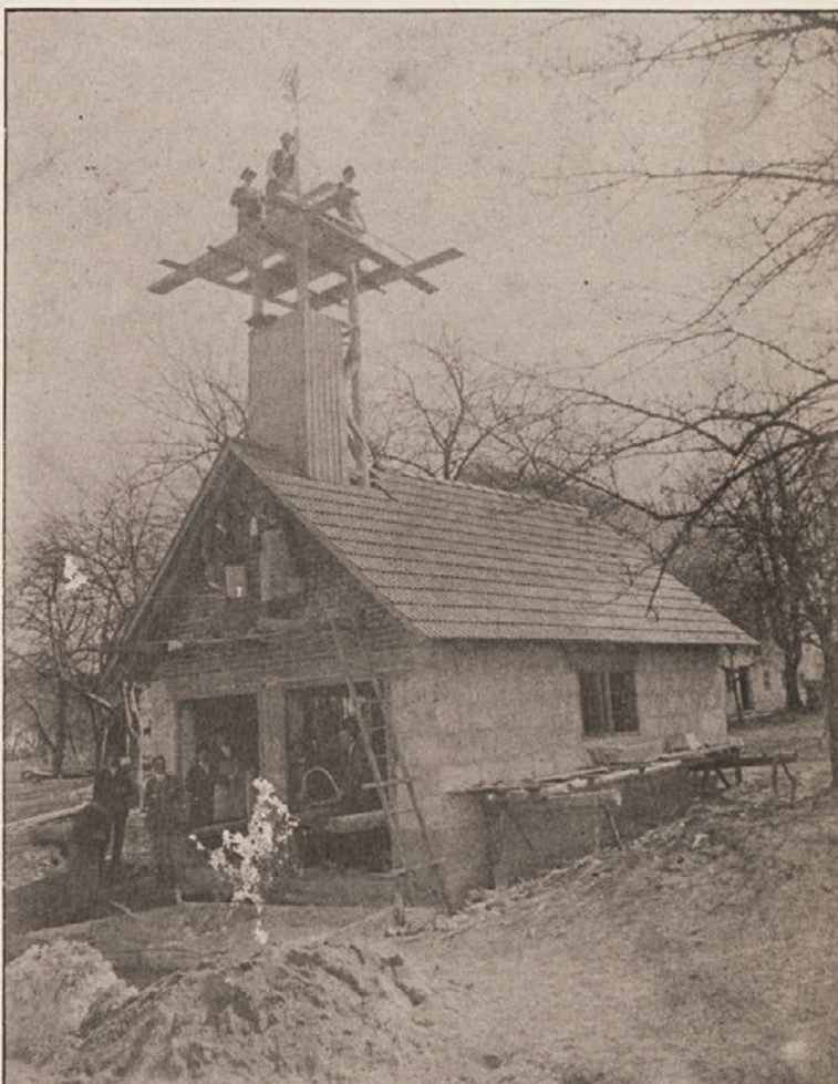
Leta 1933 so v Globasnici, tam kjer je danes gostilna Šoštar, zgradili gasilski dom, ki je služil tedanjim globaškim gasilcem. Na sliki vidite, kako so gasilci gradili dom.