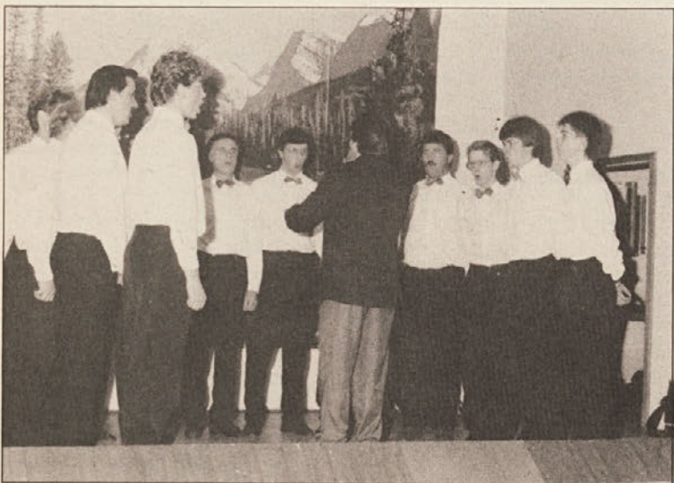
MoPZ „Valentin Polanšek“ je navdušil s svojim nastopom.