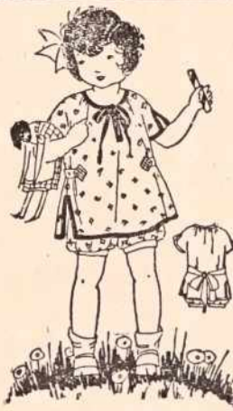
McCall Printed Pattern 3613

ETE bloomer oblejcs sze tak nalehki poskali na tejo i na lehki sze zgotovi, ka je tou lejpo!