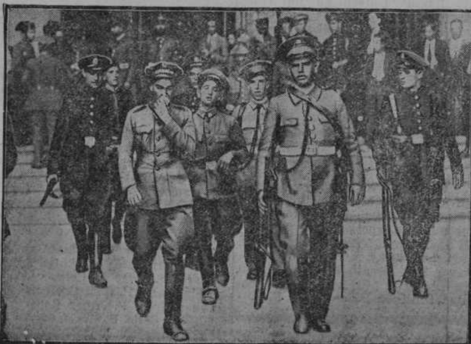
Po ponesrečeni revoluciji na španskem odžene policija v zapor one revolucije, ki so se hoteli polastiti prometnega ministrstva.