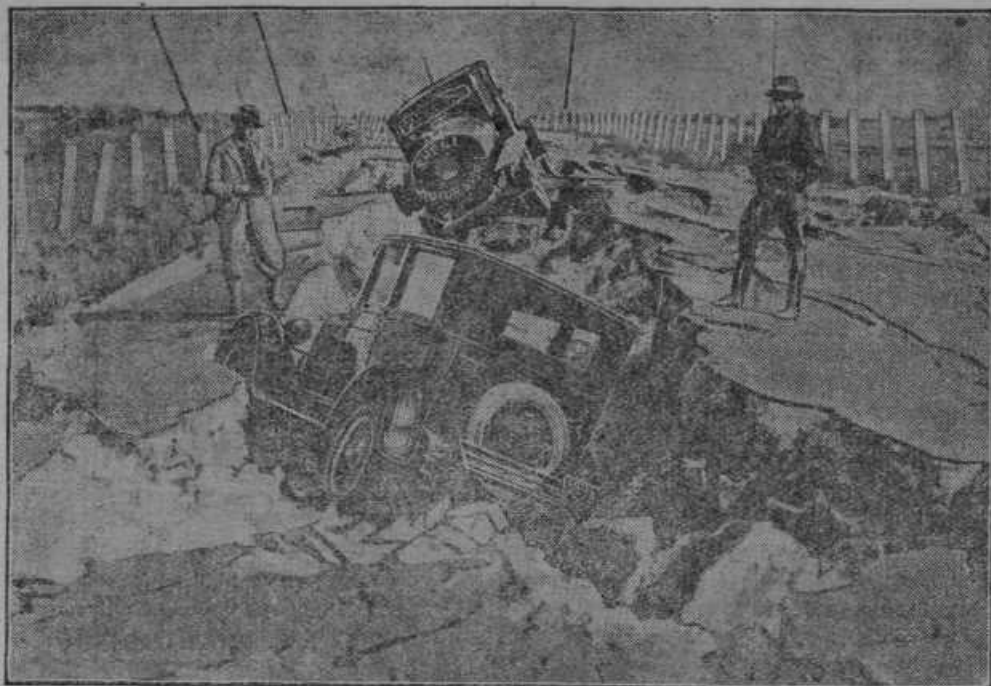
Potresna razdejanja na otoku Nova Zelandija. Slika nam kaže po potresu povzročene udrtine na cestah, v katerih so izginila v trenutkih potresa razna vozila.