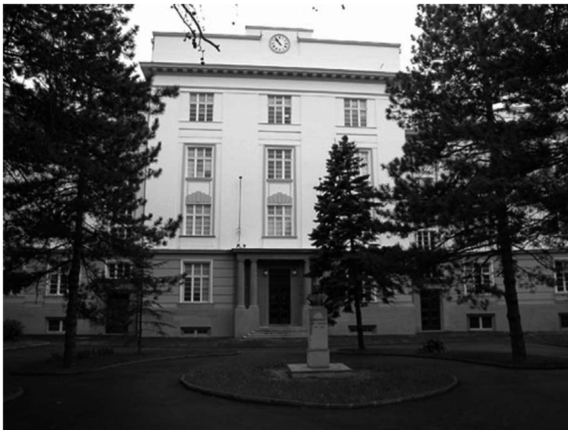
Slika 1: Zgrada Arhiva Jugoslavije

Zgrada Arhiva Jugoslavije u ulici Vase Pelagića 33u Beogradu je jedna od retkih koja zadovoljava uslov zaštitne zone mada nije reč o namenski rađenom objektu. Izgrađena je na uzvišenju daleko od vodenih tokova i podzemnih voda, na velikom placu tako da se ne graniči sa drugim obkekatima već je okružena velikim dvorištem i zelenilom..Zgrada Arhiva Jugoslavije izgrađena je kao zadužbina kralja Aleksandra i Karađorđevića, a po projektu arhitekta Vojina Petrovića. Trospratna zgrada oblikovana je u stilu akademizma, korisne površine oko 8.000 kvadratnih metara, sa glavnom fasadom okrenutom prema Topčiderskoj zvezdi. Prvobitno je bila zgrada Doma kralja Aleksandra I za učenike srednjih škola. Arhiv Jugoslavije je dobio ovaj objekat 1969.godine. www.arhivynika.u.gov.rs/.../st...arhivu/zgrada_arhiva/istorijat_zgrade.html .