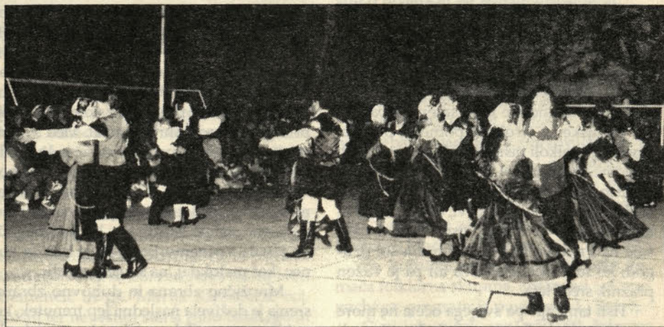
Ples v narodnih nošah ob slovenskih melodijah.