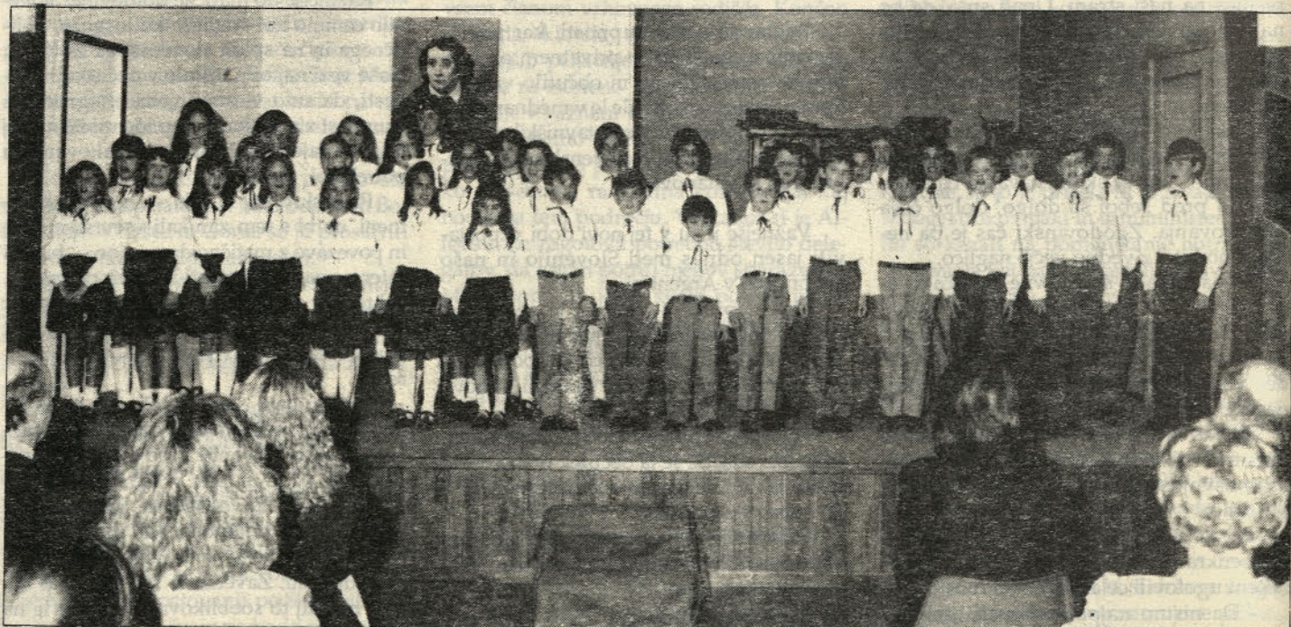
Učenci Prešernove šole ob proslavi 40-letnici slovenske šole