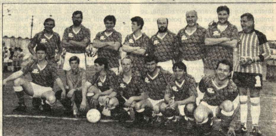
Nogometno moštvo Slovenske vasi.

ša druga slovenska zgodovina se je pričela takrat, ko so naši starši odšli iz Slovenije; imamo svojo avtohtono zgodovino v zdomstvu. Ohranjamo spomin na tehtne vzroke, zaradi katerih so se naši starši podali v domstvo. Spremljata nas zavest in zvestoba do te preteklosti.