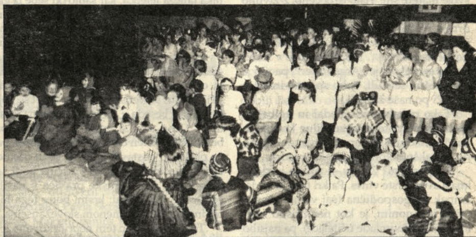
Skupinska slika ob zaključku prireditve.