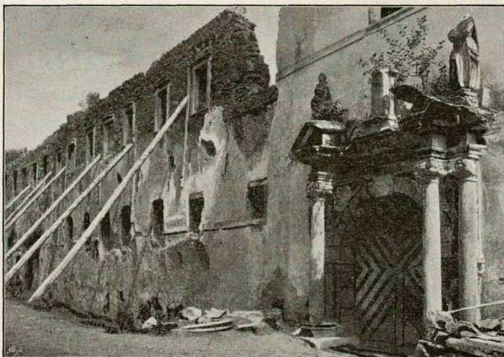
Ostanki zajčkega samostana.

v novo gotsko obliko, kakoršno je imela v poznejšem času, pač šele v začetku 15. stoletja. Tedaj se je za tretjino povikšala, dobila znotraj štiri križne svode nad ladijo in mnogokotni svod nad velikim oltarjem, zunaj pa podpornike, gotska okna in olepšavo v tem novem zlogu. Imela je podobo pravokotnika (dolžina 30 m, širina 7 m) in proti vshodu apsido, ograjeno s peterimi stranmi pravilnega osmerokotnika. Na južni strani cerkve je prizidana zakristija 1) , ki je bila najprej kapela, v kateri so opravljali menihi svojo službo, dokler še ni bila zgrajena cerkev (l. 1194.). V tej kapeli je počival Ulrik Savinjski, sedmi slobodni gospod 2) , in tukaj so