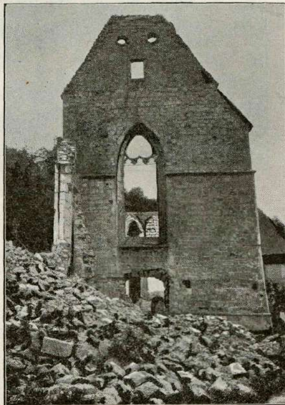
Razvaline cerkve zajčkega samostana.

Med celo vrsto stavb, hodnikov in zagraj vzbudi našo pozornost najprej samostanska cerkev, ki je središče celega sela. Kdaj je bila ta