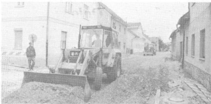
Cesta IV bo kmalu dobila asfaltno prevleko

V kulturnem programu pa se bodo predstavili mladi Rožnodolčani s svojimi vrstniki, ki obiskujejo tamkajšnje vzgojno varstveno ustanovo oziroma nabirajo znanje v osnovnih šolah Marjan Novak-Jovo in Majde Vrhovnik.