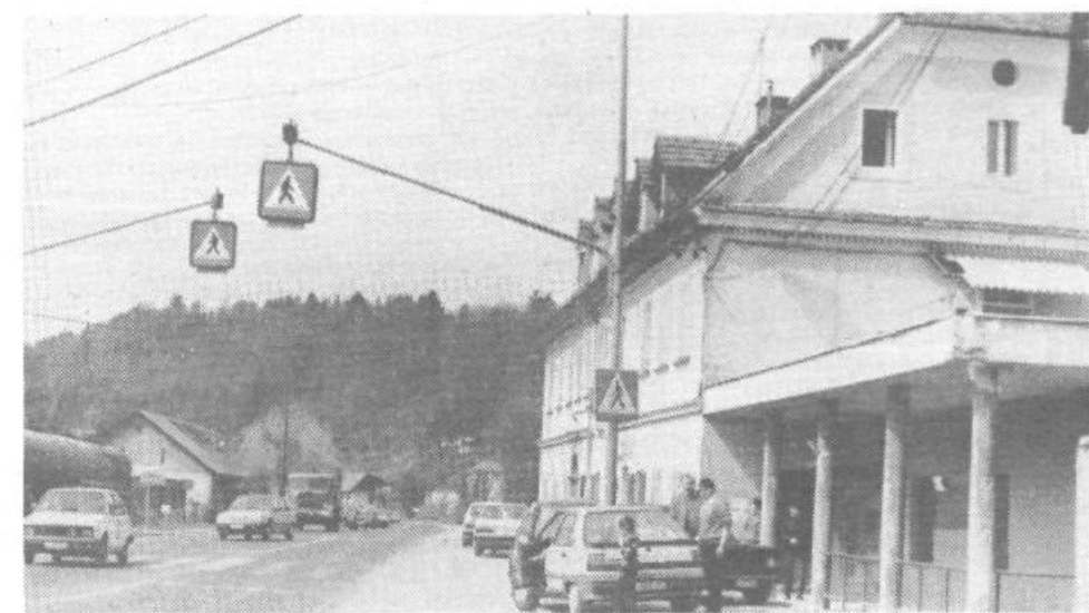
Promet na Dolenjski cesti postaja vse nevarnejši