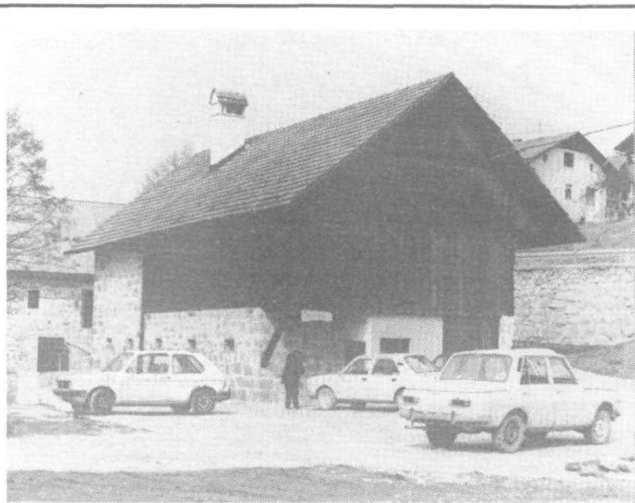
Trubarjeva spominska zbirka privablja vsak dan veliko obiskovalcev

Lašče in Hoja, TOZD Žaga Rob; kozolec KZ Velike Lašče, mlin, ki ga čaka še nekaj obnovitvenih del, pa obnavlja Žito Ljubljana, TOZD Mlini. Še vrsta drugih delovnih organizacij nam je z delom ali materialom priskočilo na pomoč in brez katerih spominski kompleks ne bi dobil zdajšnje podobe. Zdaj je treba dokončno urediti še okolico in cestni prometni sistem. Seveda pa tudi akcija Trubarjev dinar še vedno teče.