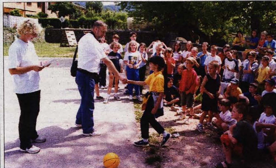
Junij 2002, na dvojezični šoli imajo v sodelovanju z ZSSDI športni dan

Dvojezično šolsko središče v Špetru bo obiskovalo 189 otrok