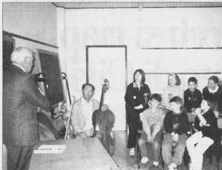
Od letos naj bi za tečaje rezijanskega dialekta skrbelo deželno šolsko ravnateljstvo