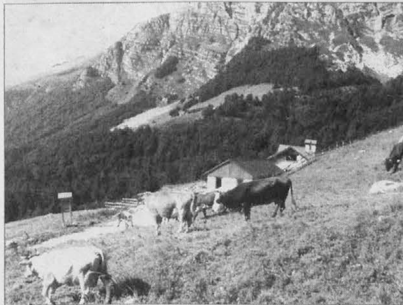
Mucche al pascolo nella malga Coot, foto tratta dal "Näs Kolindrin" 2001

Il lavoro di recupero, come si poteva immaginare, era stato seguito anche da commenti scettici della serie "Lassù non conviene investire. Sono soldi buttati via!". Valeva o non valeva la pena investire tutto quel capitale ai piedi del monte