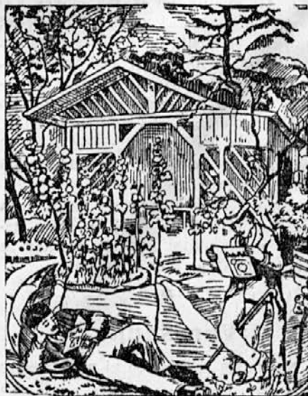
Kje je tretji čitatelj?