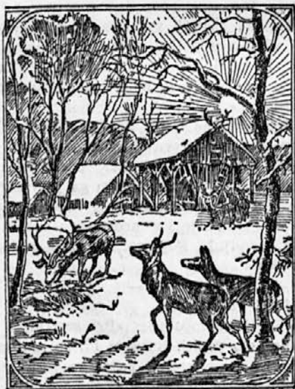
Kdo krmi te ljubke živalice?