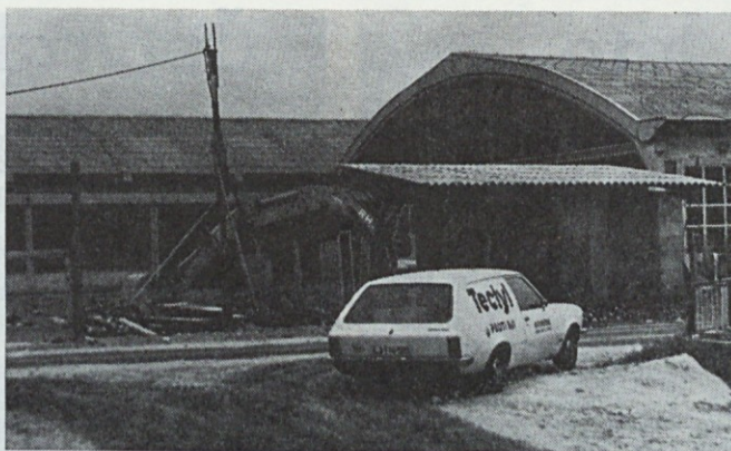
Trenutek z gradbišča na Celovski cesti 228. Slika posneta maja 1978