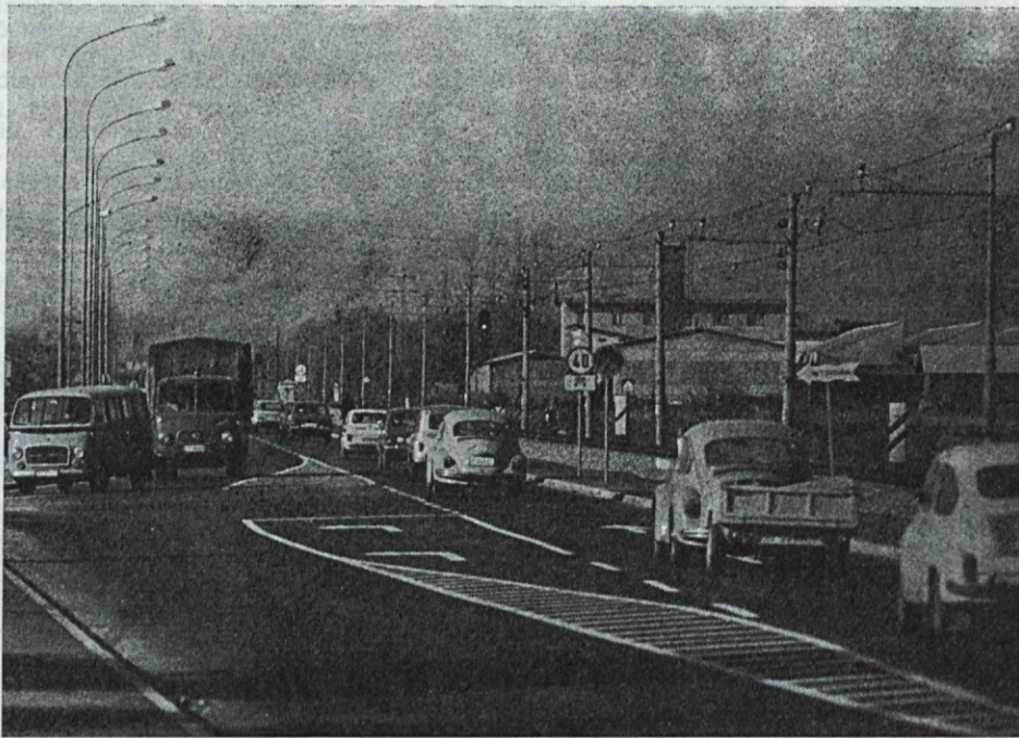
Ali veste, kaj je na sliki? Naj vam pomagamo. Nova »industrijska cesta« in novi dostop do servisov in konsignacij naše DO, ki bo v uporabi vse tja do konca junija 1979.

Uganite, zakaj se naše stranke lahko zapeljejo mimo odcepa v objekt na Celovski cesti 228?