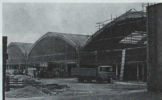
Ta slika kaže že skoraj končano halo novembra letos