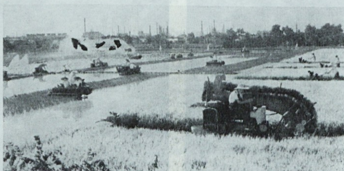
Delo na riževem polju

Iz obsežnega opisa vodje oddelka na plantaži v kmečki komuni Ču Šušina sem si poleg škodljivih vplivov »bande štirih« na njeno proizvodnjo uspela zapomniti predvsem tole: