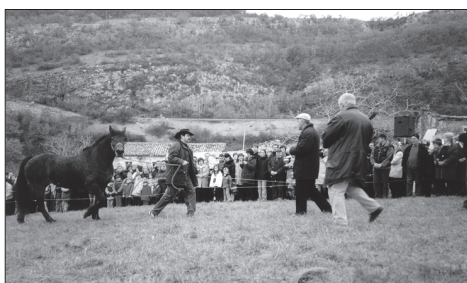
Slika 9: Žegnanje konj