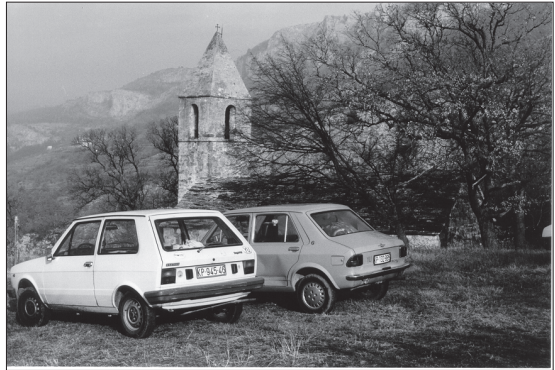
Slika 3: Avtomobila, parkirana ob cesti, ki pripelje iz Dola, ob poti, ki zavije k cerkvi in pokopališču