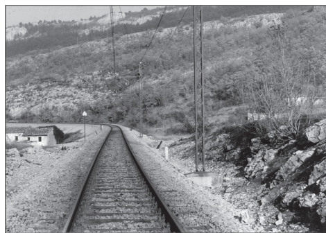
Slika 1: Nasip železniške proge Kozina–Koper med zapuščenimi hišami (foto: M. Ravnik, 1988)

Sv. Štefan je bil in je še vedno najpomembnejši praznik Zanigrada. Vsako leto se na dan zberejo nekdanji Zanigrajci in njihovi potomci in sorodniki, prebivalci bližnjih vasi in širšega območja Kraškega roba in Rižanske doline. V zadnjem desetletju, od leta 1995, je bilo v praznovanje vključeno tudi žegnanje konj, ki ga tod prej niso poznali. Konj tudi imeli