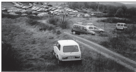
Slika 7: Polno parkirišče in avtomobili, parkirani ob poti skozi vas, pogled z železniškega nasipa

Prireditelji, ki smo jih omenili, se stva-