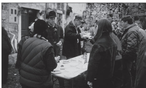
Slika 10: Tapčeva korta, pogostitev obiskovalcev, ki so privedli konje