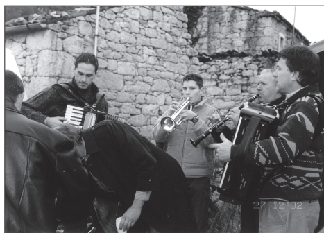
Sliki 13 in 14: Bržanijski fantje se dogovarjajo o naslednji glasbeni točki in jo zaigrajo (, 26. 12. 2002)