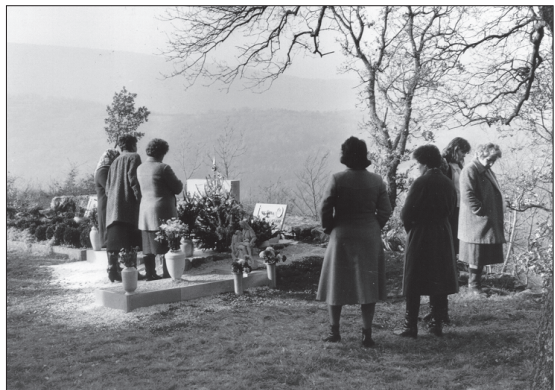
Slika 4: Ljudje se zbirajo na pokopališču pred mašo