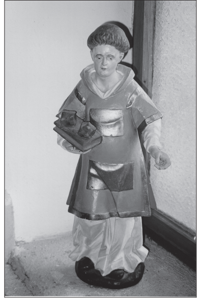
Slika 2: Kipec sv. Štefana, shranjen na fari , v župnišču v Predloki

Vsekakor lahko povzamemo, da je ena od zani-grajskih posebnosti staro izročilo o treh družinah in treh cerkvah in v zadnjem času, vsaj od konca 19. stoletja, nedvomno tesna povezanost družine Rožnik in cerkve sv. Štefana. 13 Od kdaj in kod je to izviralo in ali je šlo samo za dolgo nadaljevanje skrbništva za cerkev iz roda v rod (čeprav zapis Josipa Sancina iz konca 19. stol. govori ravno nasprotno, da so se cerkovniki menjali vsak teden), bo morda razjasnila kaka prihodnja raziskava.