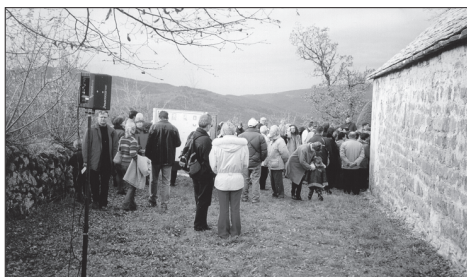
Slika 8: Med mašo