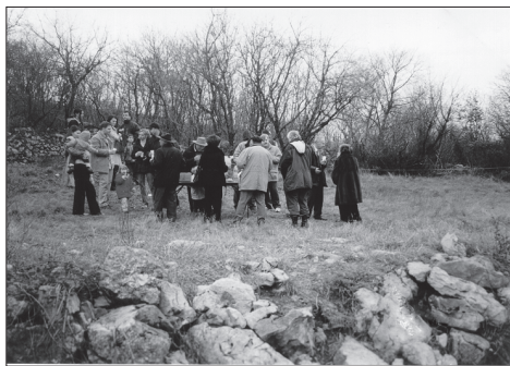
Slika 11: Sorodniki, sosjedje, znanci, prijatelji ob hrani in pijači, po žegnanju konj