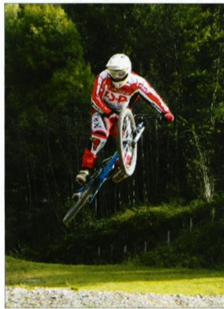
Volf skok