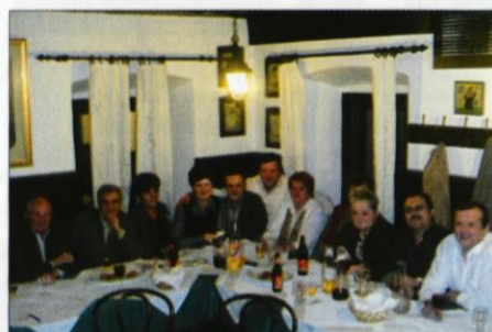
Stara krajevna skupnost na družabnem večeru

Že v navadi je, da se ob koncu leta na priložnostnih srečanjih poveselimo, si nanizamo uspehe ali neuspehe iz preteklega leta ali preživimo skupaj prijetne večerne urice. Prav takšen družabni večer smo pred dnevi doživeli nekdanji člani Sveta krajevne