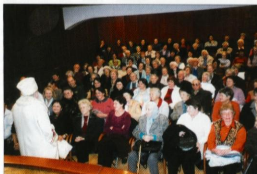
K dobremu razpoloženju je prav gotovo pripomogel tudi Miklavž.