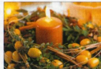
Vonj cimeta in nageljnove žbic. Osnovni obroč je obdan s pušpanom in okrašen s kumkvatom, z nageljnove žbicami in s cimetovimi paličicami.