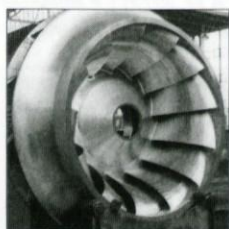
Rotor Francisove turbine

Po letih negotovosti se nekdanjemu Litostroju, ki ga sedaj sestavlja pet samostojnih podjetij, obetajo boljši časi. Zaradi obilice naročil potrebujejo mlade delavce kovinarskih poklicev; od strojnih mehanikov, instalaterjev, monterjev do strugarjev, rezkalcev, orodjarjev in drugih.