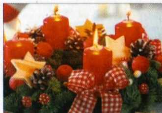
Stari dobri božični čas. V klasični rdeči in zeleni kaže venec iz jelkinih vej podeželsko očarljivost.