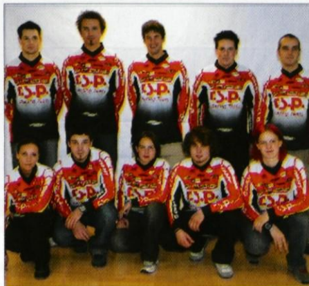
RSP Team 2005

Snurfcluba, za njegovo telesno pripravljenost pa bo še naprej skrbel trener Luka Žele. Ob novostih so se za zadnjo sezono v mladinski