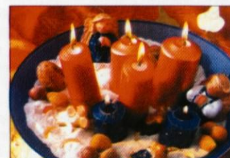
Advent na pečeni obali. Zamisel je nenavadna in jo je lahko posnemati: plitvo skledo napolnite s peskom, postavite vanj sveče in po želji dodate majhne okrasne dodatke.

odrobil glavo, zato ga je takoj zadela zaslužena kazen: vanj je treščila strela. Na dan, ko praznuje svoj god ta lepa svetnica, je treba po stari šegi odrezati črnejeve, višnjeve, slivove vejice. Te vejice režemo ali pred sončnim vzhodom ali po sončnem zahodu. Položimo jih v toplo vodo in postavimo poleg tople peči. Do božičnega večera se vejice razcvetijo. Nekoč so verjeli, da razcvetele vejice prinašajo srečo, blaginjo in dobro letino.