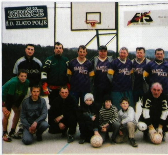
Stari in mladi na koncu nogometne sezone

S tekmo STARI : MLADI so na martinovo nedeljo Zlatopoljci zaključili letošnjo bogato nogometno sezono.