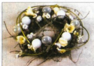
Prevladuje bela barva. Venček s storžki in z lišaji preraščene vejice.

Četrty december je dan sv. Barbare. Ta svetnica je po legendi živeła v 3. stol. in je bila tako lepa, da jo je oče, poganski kralj Dioskur, zaprl v stolp. Od nje je zahteval, naj se poroči s kraljevičem Fabricijem, ona pa je to odklonila, ker je skrivaj sprejela krščansko vero. Oče je pobesnel, Barbari je z lastnimi rokami