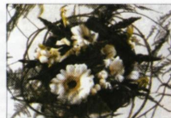
Črno-belo ko zmanjka naravnih dodatkov, dodamo kanček zelene in sopek zaživi