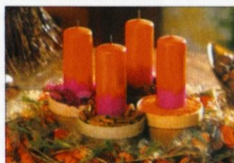
Ustvarjalni vrtni venec. Sadeži, cvetovi, začimbe in glineni lonci so materiali za ta naraven okras.