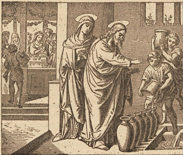
Jezusov prvi čudež