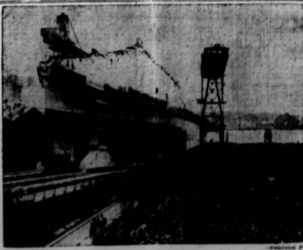
Nova nemška bojna ladja, ki je bila nedavno spuščena v morje v Wilhelmshavenu.