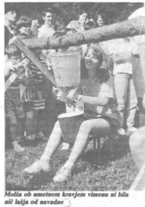
Molza ob umetnem kravjem vimezu ni bila nič lažja od navadne