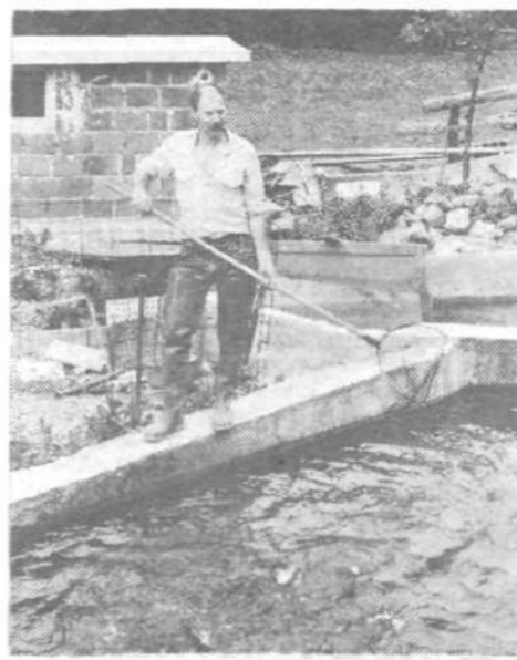
V RIBOGOJNICI BRANKA GRDADOLNIKA NA VRZDENCU