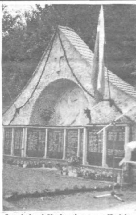
Spominska plošča domobrancem v Horjulu