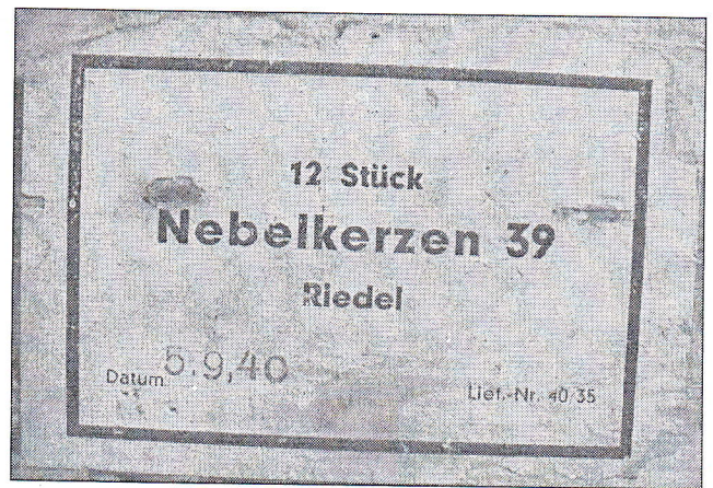
Slika 4: Notranja stran pokrova majhnega zaboja; ohranila se je nalepka s podatki o vsebini (dimne granate) in datum pakiranja. (Hrani: K, F)

»Povedal bi še to, kaj sem videl, ko sem bil pri Podgorelcu. Tam je bil neki mehanik, doma še naprej od Lahoncev. Med vojno je bilo sestreljeno neko angleško letalo, pravzaprav bi moral reči bombnik. In ko je v Ključarovcih strmoglavljalo, je po gozdu od zgoraj posekalo vse vrhove bukev, in to debele okrog 30 cm, vse odrezalo ... Bil je štirimotorni bombnik in tisti mehanik je enega od motorjev usposobil, tako da je imel potem Podgorelec bencinski pogon za svoje stroje.« (J)