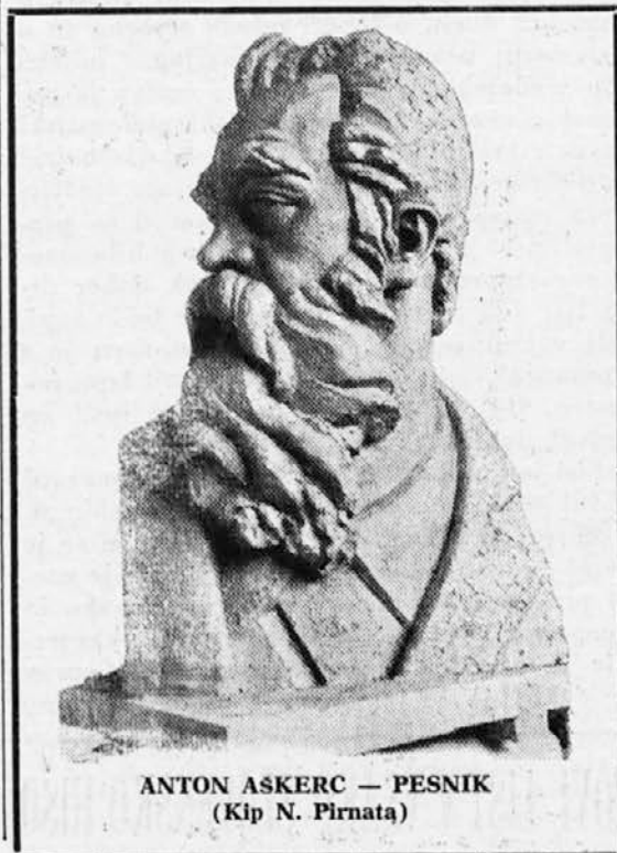
ANTON ASKERC — PESNIK (Kip N. Pirnata)