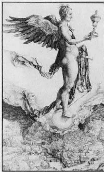
Albrecht Dürer, Nemesis , 1501-1502

Zeit um 1500. 1500 circa - ta, na prvi pogled neobičajni naslov združuje tri samostojne razstave, ki so jih skupno podprle dežele Tirolska, Tridentinska in Zgornje Poadižje; namepravajo prikazati podobo zgodovinske Tirolske na ključnem prehodu iz 15. v 16. stoletje.