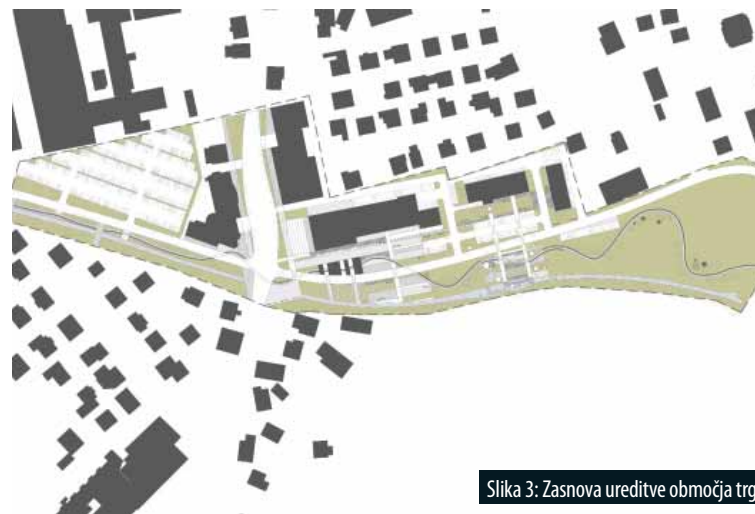
Slika 3: Zasnova ureditve območja trga.

When studying the inclusion of different public, community programmes and tourist activities and looking for new development possibilities, the spatial inventory was performed in the wider cultural landscape area of the town of Žiri. The potential capacity for encouraging tourist activities can be identified in all built structures of the municipality; however, the open landscape area represents the hidden potential and the greatest challenge which could be – through the preservation of heritage, revitalisation and encouragement of new forms of tourism – used for development of sustainable activities. The vertical/horizontal connections (social axis/recreation axis) are of key importance, and together they create an unmistakable space-time network in the structure of the landscape.