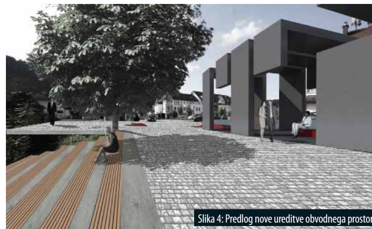
Slika 4: Predlog nove ureditve obvodnega prostora.