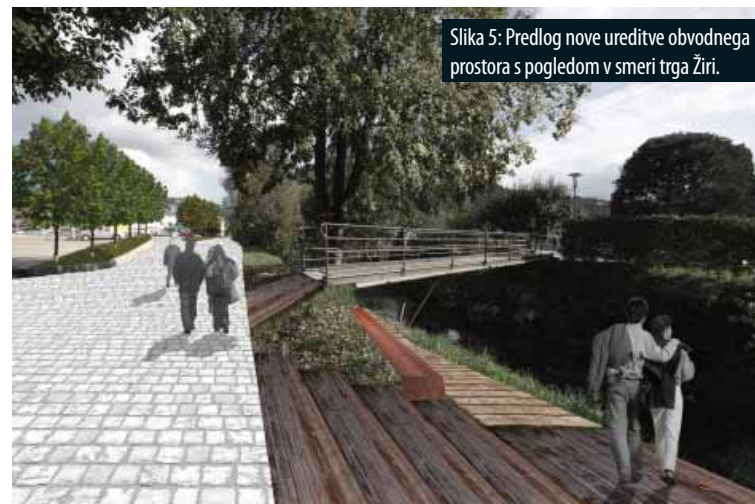
Slika 5: Predlog nove ureditve obvodnega prostora s pogledom v smeri trga Žiri.