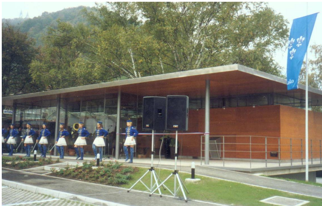
***** slika TIC – Tic.jpg ***** ***** tekst: Od sedaj naprej lažje do turističnih informacij

Vrata TIC-a so med tednom odprta od 7.00 do 17.00 ure, v soboto od 8.00 do 12.00 ure. Za tiste, ki želijo informacije kasneje, smo zunaj postavili informacijski steber, kjer so 24 ur na dan na voljo informacije. Informacijski steber bo do konca leta dopolnjen s celovito turistično ponudbo, ki jo bodo lahko obiskovalci spremljali širom sveta preko interneta na naših spletnih straneh ali neposredno v Laškem. Na straneh www.turisticnodrustvo-lasko.si opravljamo tudi internet trgovino pivovarniških reklamnih artiklov in spominkov Laškega.