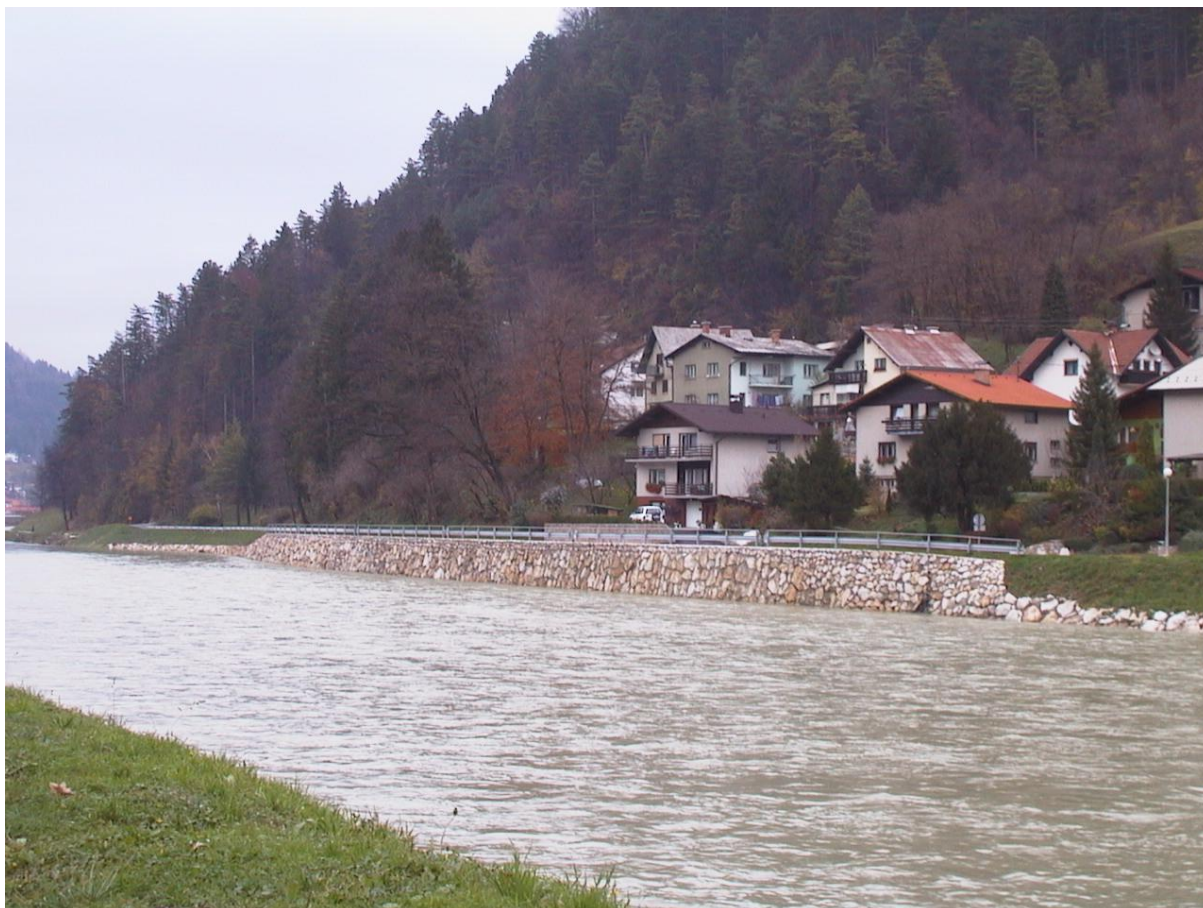
***** slika cesta v Jagoče – Jagoce.jpg ***** ***** tekst: Ureditev kolektorja in ceste v Jagoče na levem bregu Savinje

Letos poleti je bila zaključena izgradnja levoobrežnega kolektorja, etapa od J5-J8 do J13, v skupni dolžini 280 m in s tem tudi ceste iz Laškega proti Jagočam. Namen izgradnje zbirnega kolektorja je zbiranje vseh komunalnih odpadnih voda in njihovo odvajanje do skupne čistilne naprave.