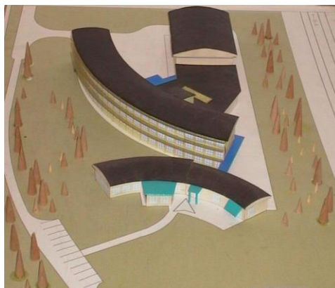
***** fotografija makete arhitekturne zasnove – Maketa.jpg ***** ***** tekst: Pogled na maketo novo šolo z vrtcem in telovadnico z južne strani

in bodoče organiziranosti šolske mreže centralne matične osnovne šole Primoža Trubarja v Laškem in pripadajočih podružničnih šol je izdelana ustrezna projektna dokumentacija za izgradnjo nove šole. Občinski svet je v juniju sprejel Investicijski program za izgradnjo šole v Debru, občina pa se je z ustrezno dokumentacijo tudi prijavila na razpis investicij posebnega pomena na področju osnovnih šol in predšolske vzgoje v Republiki Sloveniji za obdobje 2000 – 2004. Projekt šole Debro predvideva izgradnjo objekta za 12 oddelkov od prvega do devetega razreda po delih: v prvih dveh triadah po en oddelek, v zadnji triadi pa po dva oddelka. Poleg potrebnih učilnic bo šola imela centralno kuhinjo tudi za potrebe vrtca in matične šole v Laškem, ustrezne kabinete na predmetni stopnji, knjižnico z medioteko in šolsko telovadnico ter večnamenski prostor. Objekt vrtca je samostojno zasnovan za pet oddelkov in povezan s šolo. Z izgradnjo šole v Debru bo ustrezno spremenjen tudi šolski okoliš matične šole v Laškem in podružnične šole Rečica. Šolo bo obiskovalo 245 učencev, v predšolsko vzgojo v vrtcu pa bo zajetih 85 otrok. Skupna investicijska vrednost novozgrajene šole z vrtcem in telovadnico znaša 757 MIO SIT. Začetek gradnje je sicer predviden v letih 2001/2002, vendar je odvisen od sklepa Vlade Republike Slovenije o vrstnem redu prijavljenih investicij v osnovnošolski prostor v Republiki Sloveniji.