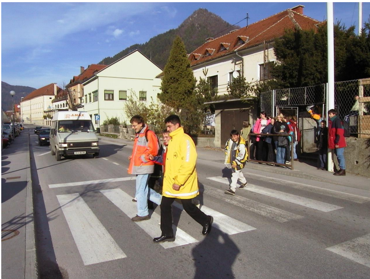
***** slika: varstvo otrok v prometu – Kanarcki.jpg ***** ***** tekst: Varno v šolo in nazaj, če so "kanarčki" na delu

V slovenskem prostoru najizvirnejši program pa je VARSTVO OTROK V PROMETU, ki ga izvaja Svet za preventivo in vzgojo v cestnem prometu občine Laško. Občina Laško je edina v Sloveniji, ki izvaja tak program. Vključeni so štirje delavci. Z anketo smo pridobili javno mnenje o tem programu, ki ga vsi, v anketo naključno izbrani anketiranci, pozitivno ocenjujejo, prav tako je svoje pozitivno mnenje o tem izrazila strokovna javnost. Ta program postaja, poleg programa pomoči na domu, eden najboljših ocenjenih programov.