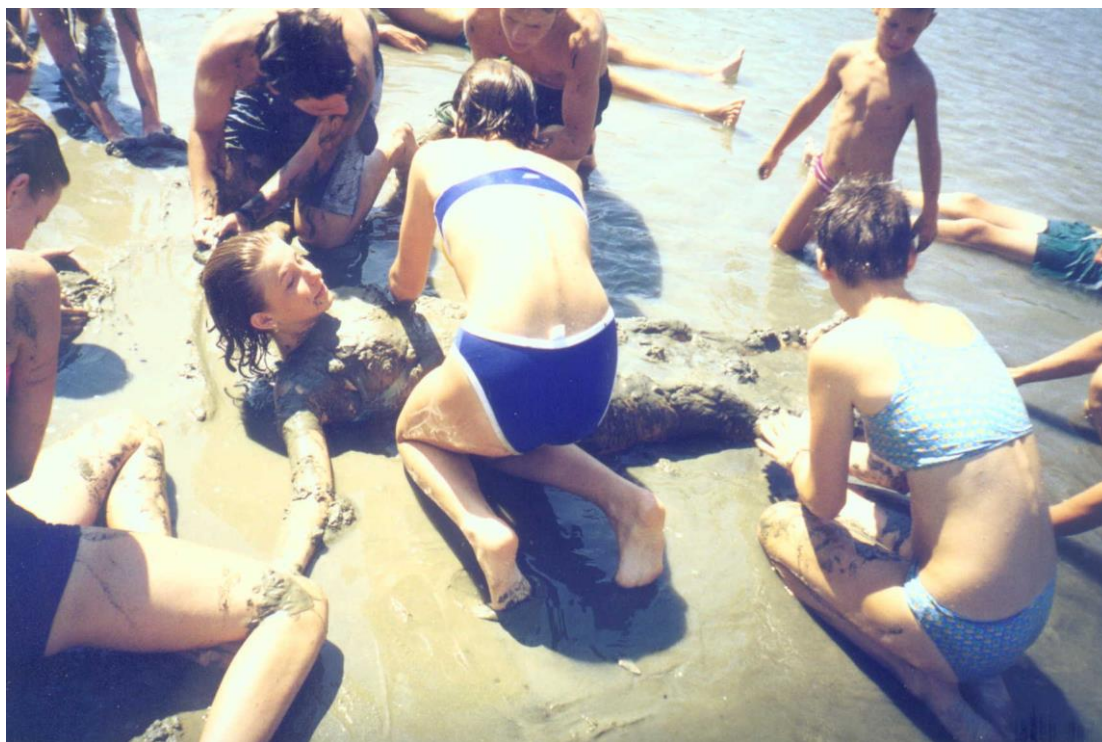
***** Slika: Otroci – Nerezine.jpg ***** ***** tekst: V Nerezinah ni nikoli dolgčas

Posebej dobro sprejet je program letovanja otrok v Nerezinah na Malem Lošinju, kjer je v letošnjem letu letovalo 225 otrok. Otroci letujejo v treh izmenah, v prvih dveh letujejo otroci samo ob spremstvu vzgojiteljev – študentov, tretja izmena pa je namenjena letovanju mlajših otrok v spremstvu enega od staršev ali starih staršev. Zlasti slednja je iz leta v leto bolj obiskana, prejemo pa tudi vedno več pozitivnih ocen.