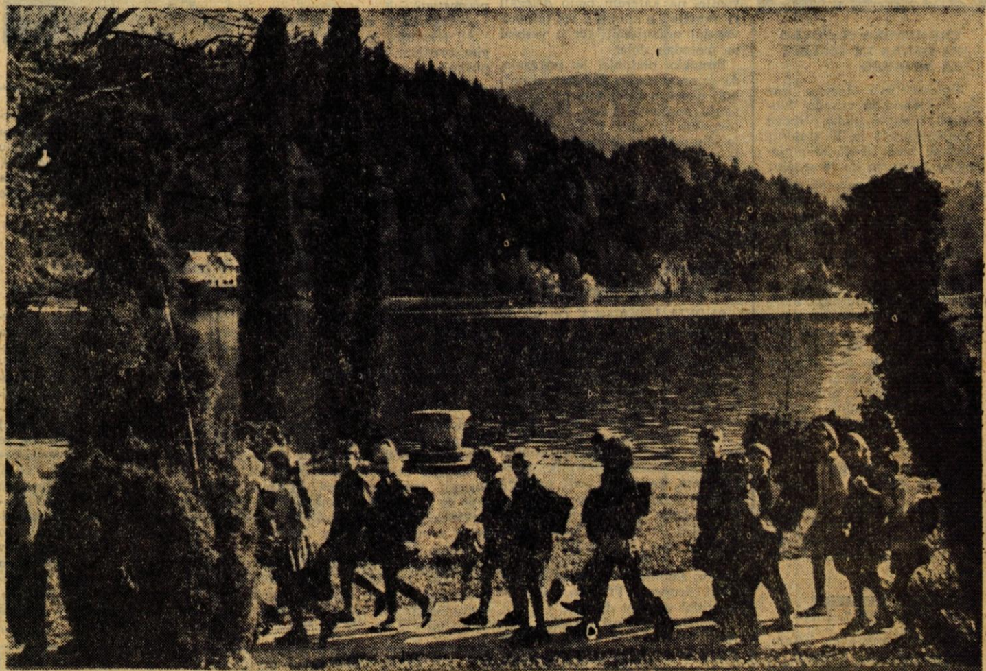
Ceprav na Gorenjskem prevladuje nestalno aprilsko vreme, se je sezona šolskih izletov v naše kraje že pričela. Otroci iz bližnjih in daljnih šol so že te dni v skupinah obiskali Bled in tako naznanili, da se bo turistična sezona kmalu pričela. Solarji so hkrati obiskali tudi Vrbo.

Ob dnevu svetovne federacije pobratenih mest