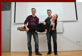
Zmagovalci Startup vikenda v Mariboru

22. - 24. novembra 2013 je bila Slovenija v znamenju Startup vikendov, ki so potekali v okviru globalnega tedna podjetništva. Študenti petih univerzitetnih mest (Ljubljana, Maribor, Novo mesto, Nova Gorica in Koper) so na šestih lokacijah razvijali in kalili svoje podjetniške ideje po najsodobnejših metodologijah (d.school, lean startup in business model generation).