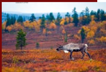
A reindeer and colors of autumn in Lapland

Three and half years ago I moved to Rovaniemi, to northern Finland in order to start my studies at the University of Lapland. With 60 000 inhabitants Rovaniemi is a small city, but it's famous and popular among travelers. We have especially lot of international visitors from Germany, Russia and Japan. There are many exotic attractions here: Aurora Borealis, Santa Claus and Husky-Safaris a few to mention. Tourism is a very important trade here, and you can even study Tourism. Research as a major at University of Lapland.