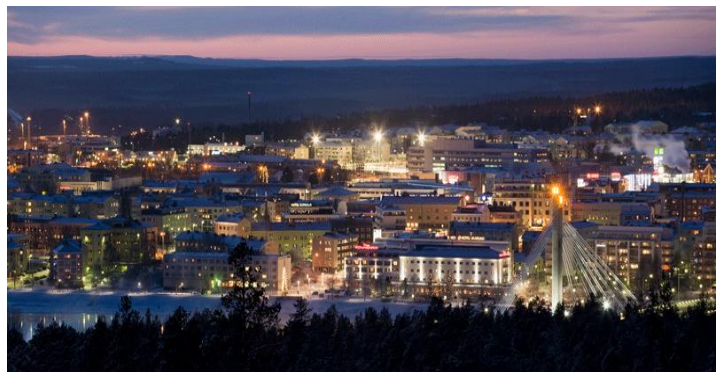
Rovaniemi city at winter time

Our university has also a special emphasis on northern and Arctic research questions. We have an Institute for Northern Culture, Arctic center and cooperation with other arctic universities. The international aspects are all in all very important at our university. The students are encouraged to go abroad; we have agreements with over 40 partner universities all over the world. Every year also ca. 200 exchange students come to Rovaniemi in order experience life and studying in our quite unique environment.