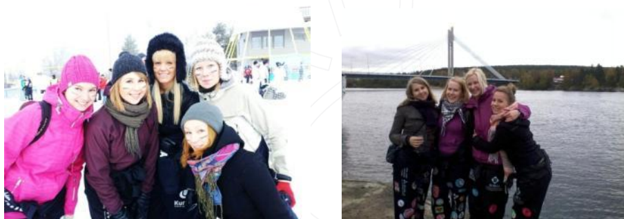
Memories from our student activities

Our university has also a special emphasis on northern and Arctic research questions. We have an Institute for Northern Culture, Arctic center and cooperation with other arctic universities. The international aspects are all in all very important at our university. The students are encouraged to go abroad; we have agreements with over 40 partner universities all over the world. Every year also ca. 200 exchange students come to Rovaniemi in order experience life and studying in our quite unique environment.