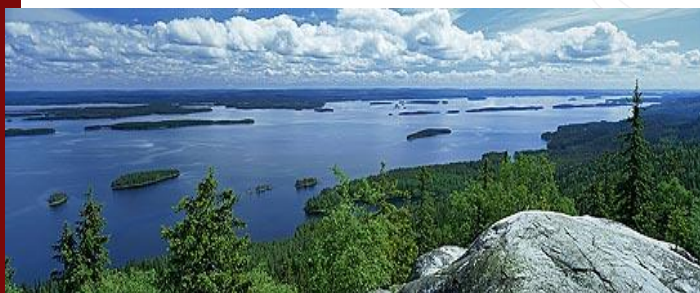
Land of thousands of lakes