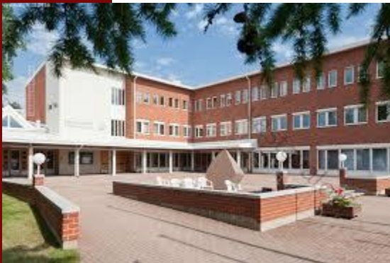
University of Lapland

University of Lapland is northernmost university in Finland and European Union. It's a multi-disciplinary science- and art-university: it's possible to study Law, Social Sciences, Education and Art&Design. We have approximately 4800 students and I think a small university is an advantage because many students and staff know each other and the atmosphere is a bit home-like. All the faculties are located at the same campus.