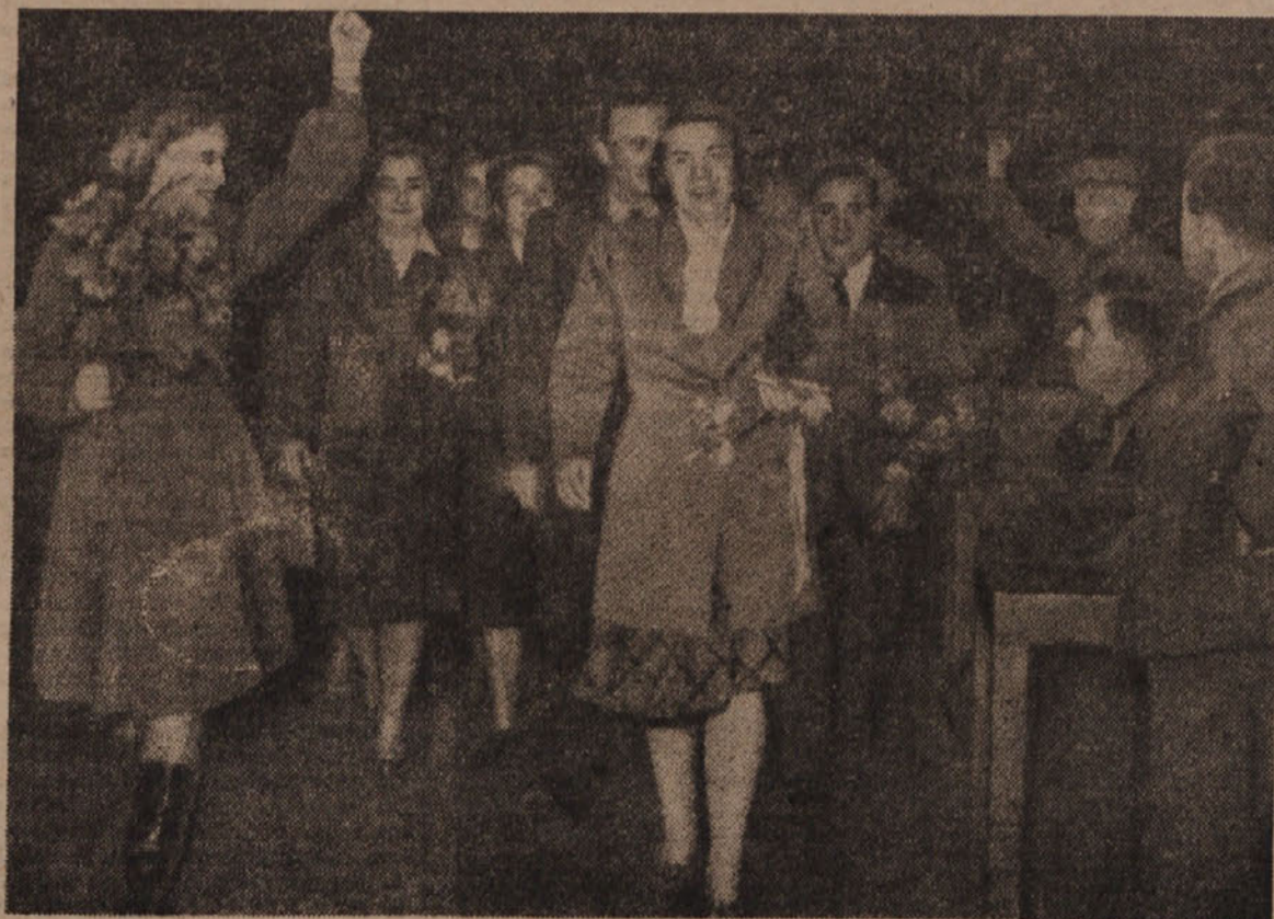
ZASTOPSTVO ITALIJANSKIH ŽENA NA OBISKU V SOVJETSKI ZVEZI

Naloga Demokratične zveze žena Nemčije je ustvariti novi tip žene, ki bo spoštoval druge narode in se boril za demokracijo in mir. Če pojde po tej poti, bo nemška žena pridobila zaupanje vseh demokratičnih narodov.