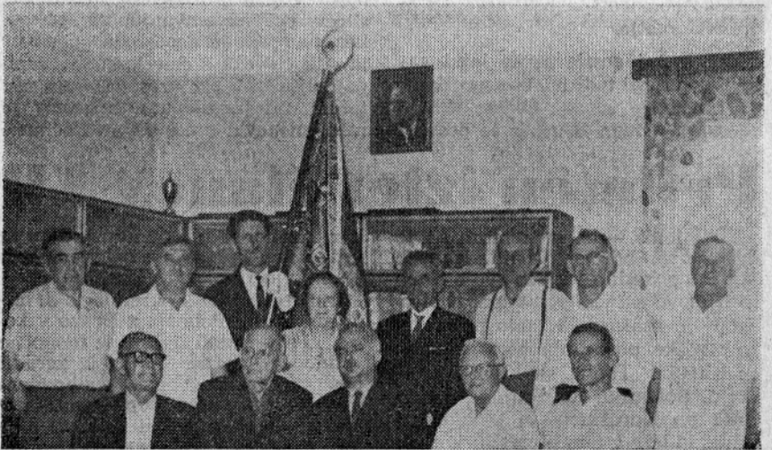
UPRAVNI ODBOR DRUŠTVA UPOKOJENCEV V RIMSKIH TOPLICAH OB RAZVITJU PRAPORA