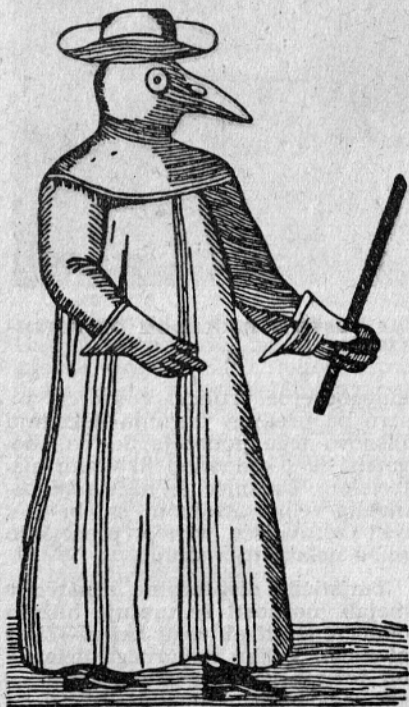
ZDRAVNIK V ZAŠČITNI OBLEKI PROTI KUGI

Oblečeni so bili v zelo dolgo haljo iz povoščenega platna ali sukna, na rokah so imeli prav take rokavice, preko obraza pa posebno masko z očali, ki je imela nekak kljun, v katerem so bile razne dišave (limona, melisa, meta, pelin), ki naj bi blažile