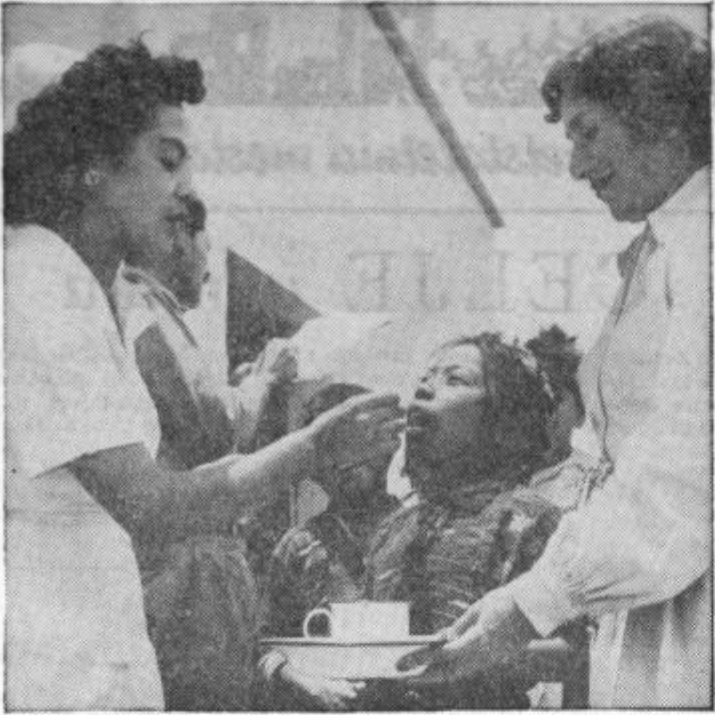
Vsako leto priredijo v ZDA Dan zdravja otrok. Vseposvodske skrbi države in privatne organizacije za zdravje in dobrobit otrok. Posebno pozornost so letos posvetili pohabljenim otrokom. — Ameriški narod se zanima tudi za zdravje otrok v drugih deželah, za kar nudi finančno pomoč, kakor tudi s strokovnjaki preko Svet. zdravstvene organizacije in Mednarodnega dečjega fonda. Zgoraj: Na neki vaški šoli v Guatemali (Srednja Amerika) prejmejo otroci tablete pred kosilo.