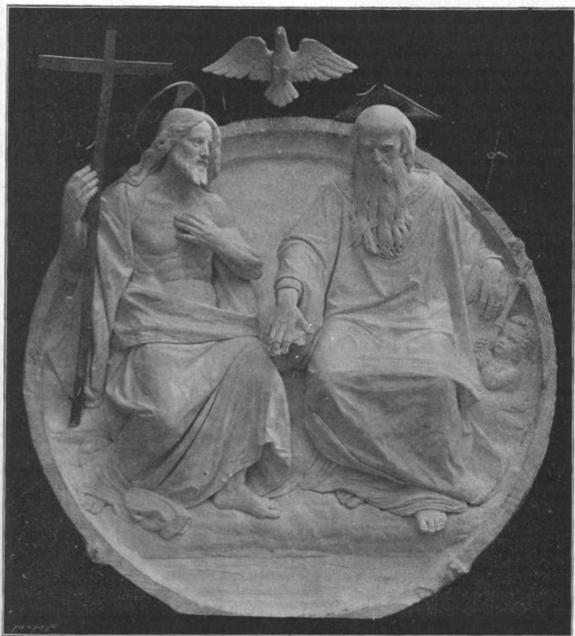
Presv. Trojica. (Relief I. Zajca za župno cerkev v Krškem.)