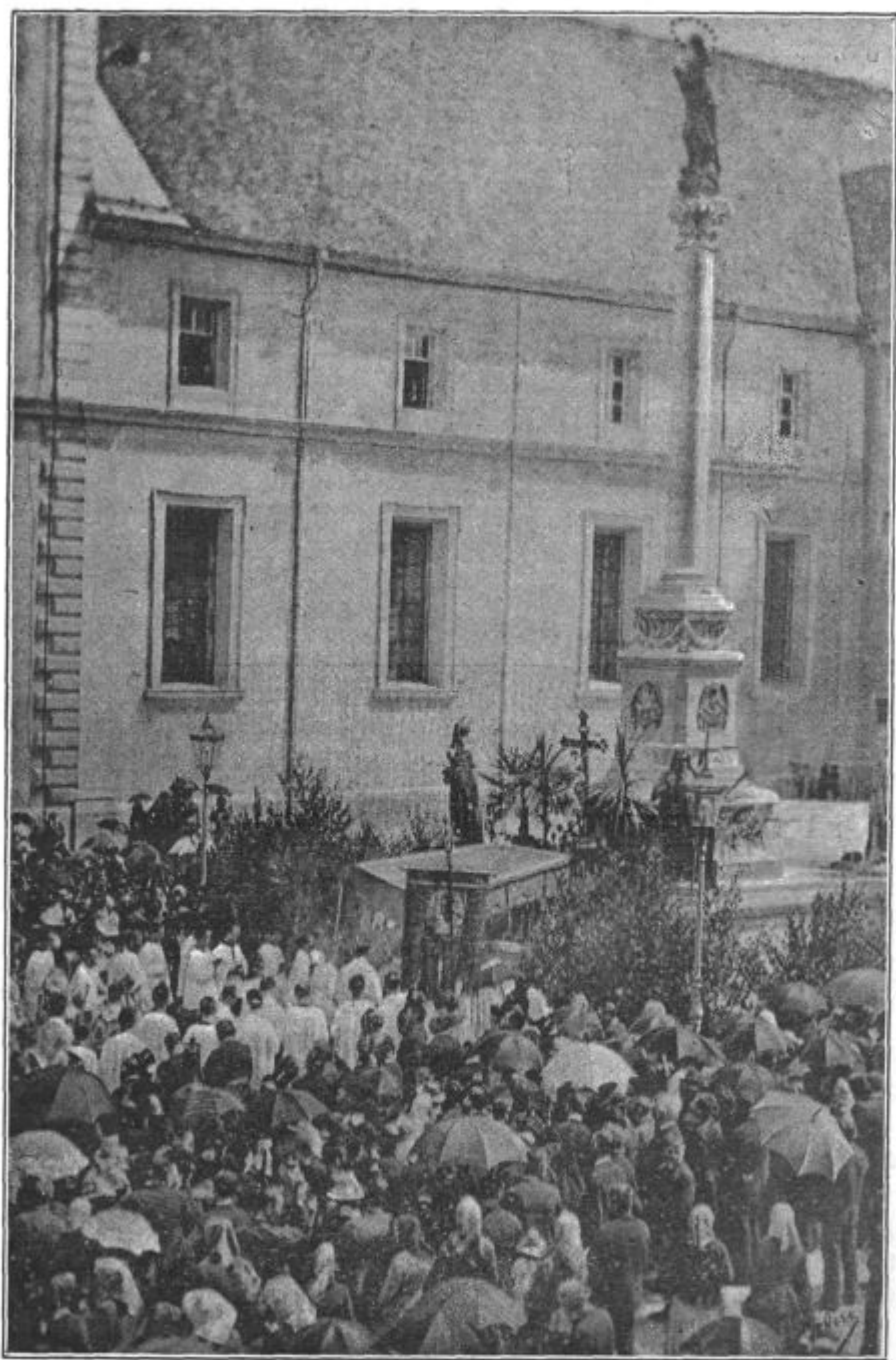
Procesija pri Sv. Jakobu v Ljubljani.